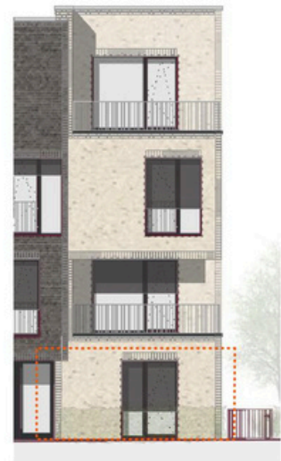
Ansicht Süd M 1:200