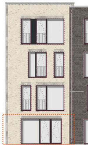
Ansicht Nord M 1:200