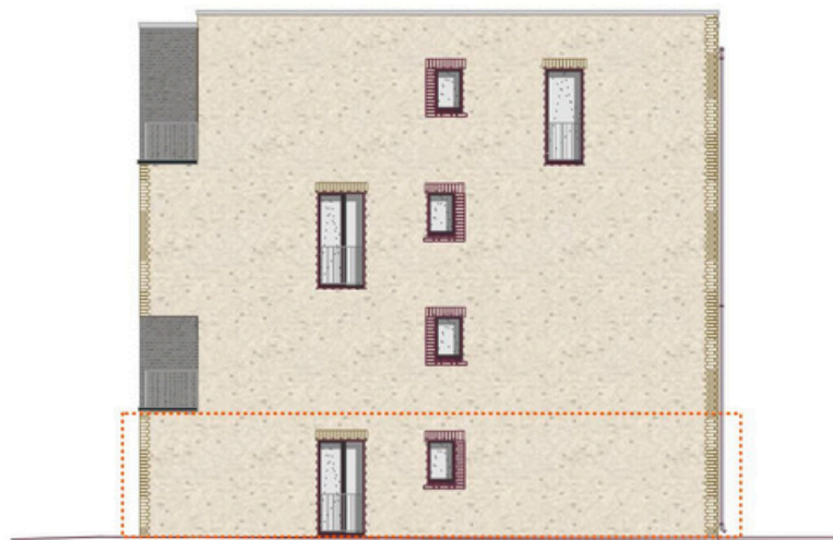
Ansicht Ost M 1:200