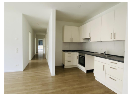
Offene Küche. EBK ohne Kühlschrank und Geschirrspüler