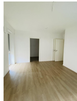
Schlafzimmer mit begehbaren Kleiderschrank