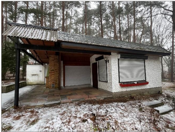
Abbildung 4: Wochenendhaus