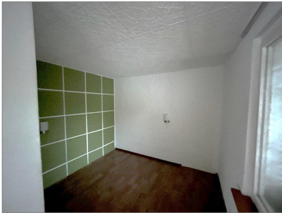
Abbildung 10: Schlafraum