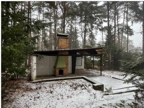
Abbildung 6: Wochenendhaus mit Terrasse und Außenkamin