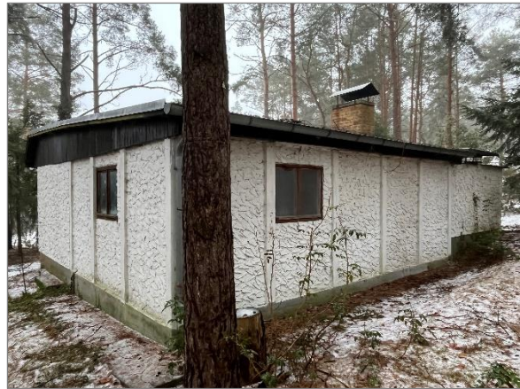
Abbildung 11: Wochenendhaus Rückansicht