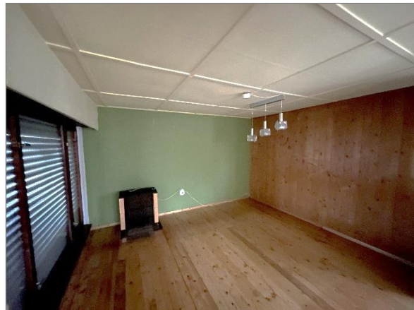
Abbildung 7: Wohnraum