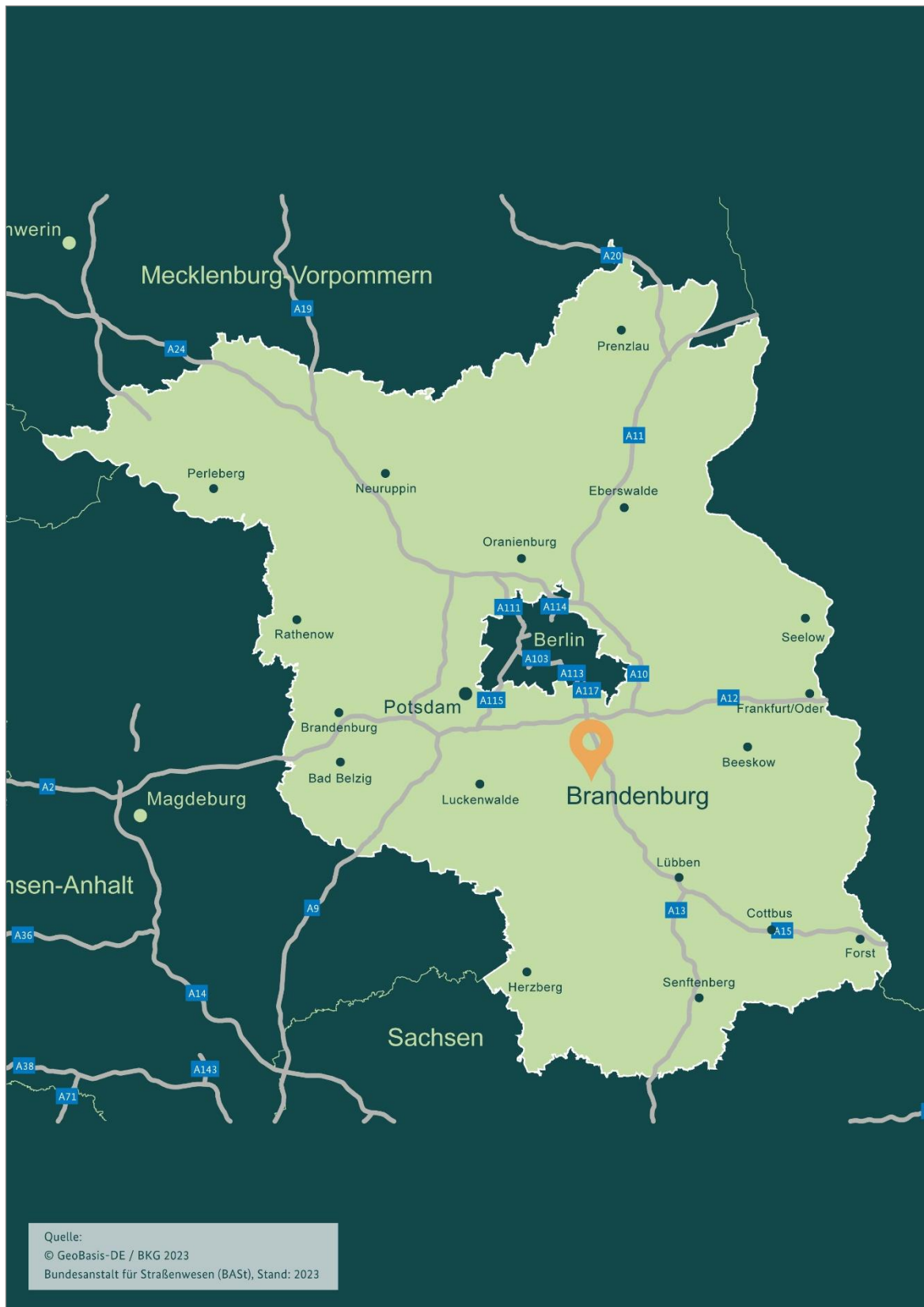
Abbildung 1: Lage im Land Brandenburg