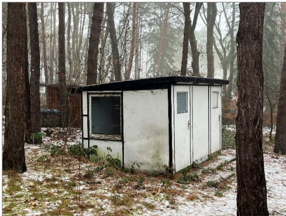
Abbildung 12: Nebengebäude