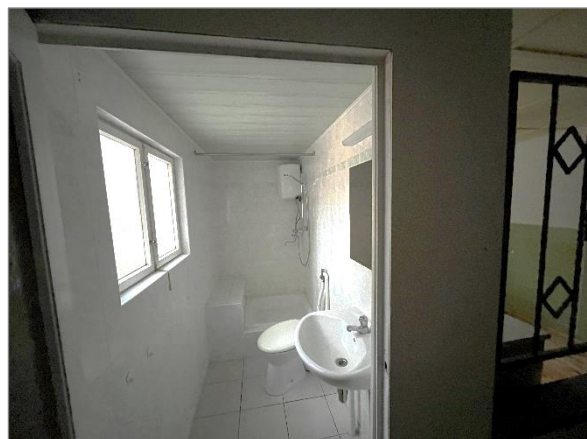
Abbildung 9: Bad