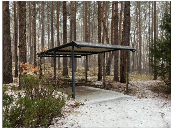
Abbildung 5: Carport