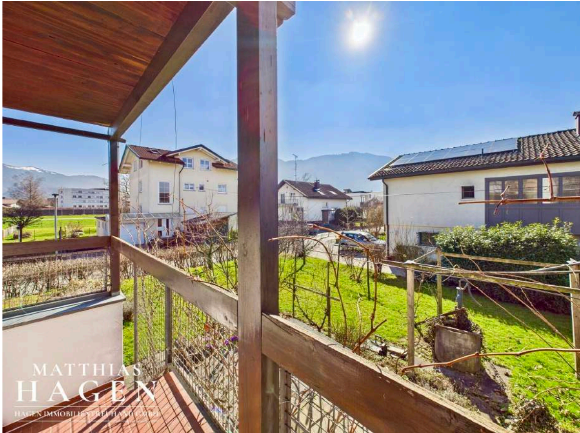
Treppe in den Garten