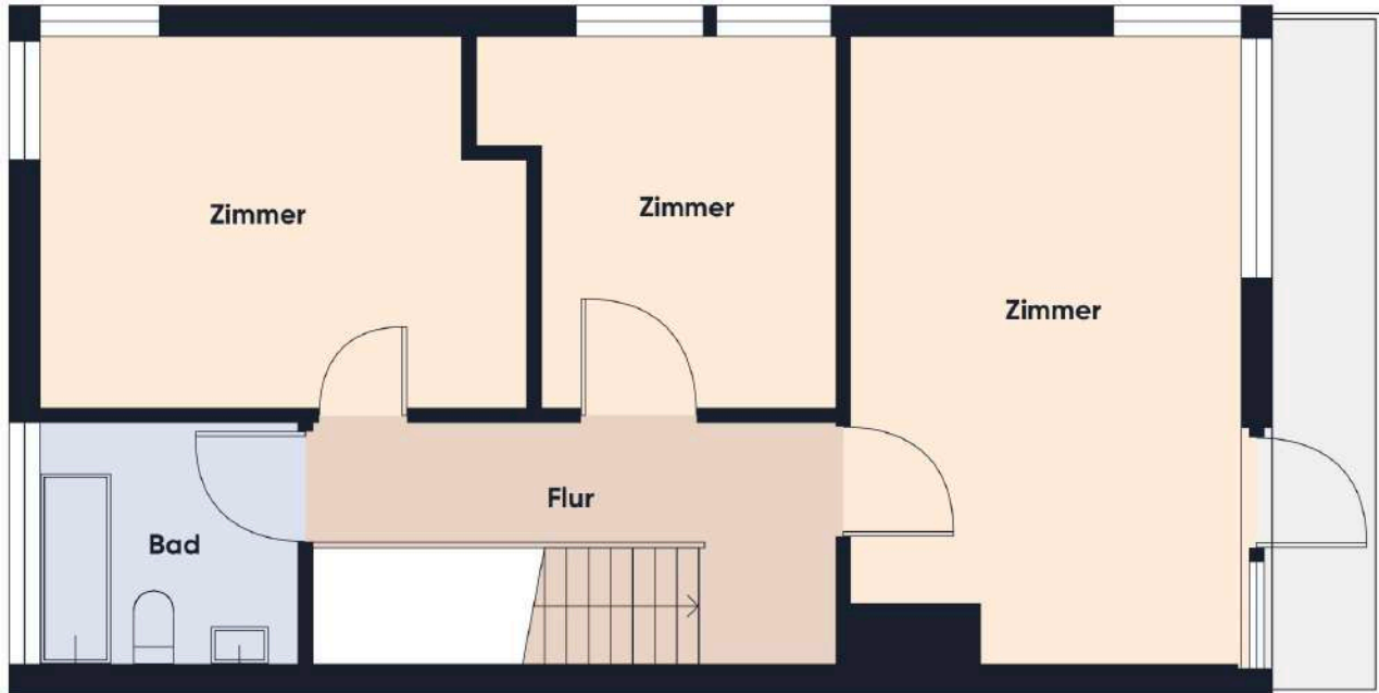
Grundrissplan ohne Maßstab DG