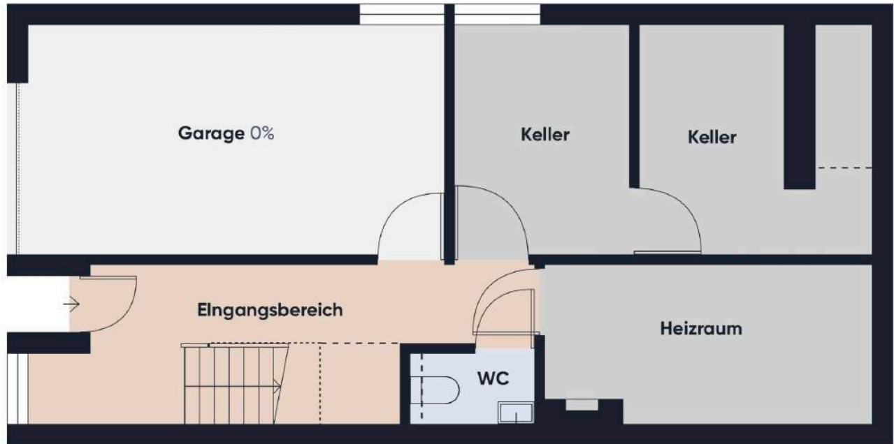
Grundrissplan ohne Maßstab EG