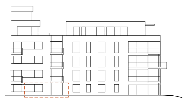
ANSICHT NORD-WEST (Hafenstrasse)