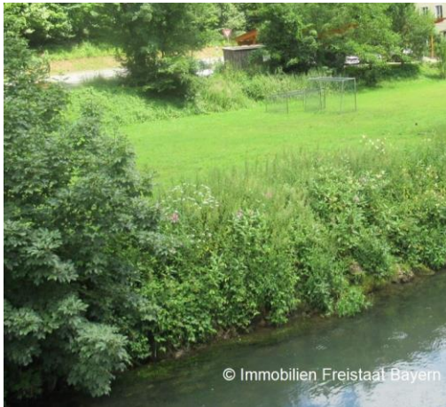
Blick vom südlichen Wiesentufer