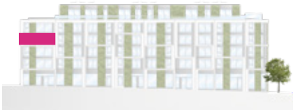
Haus A – Ansicht Süd