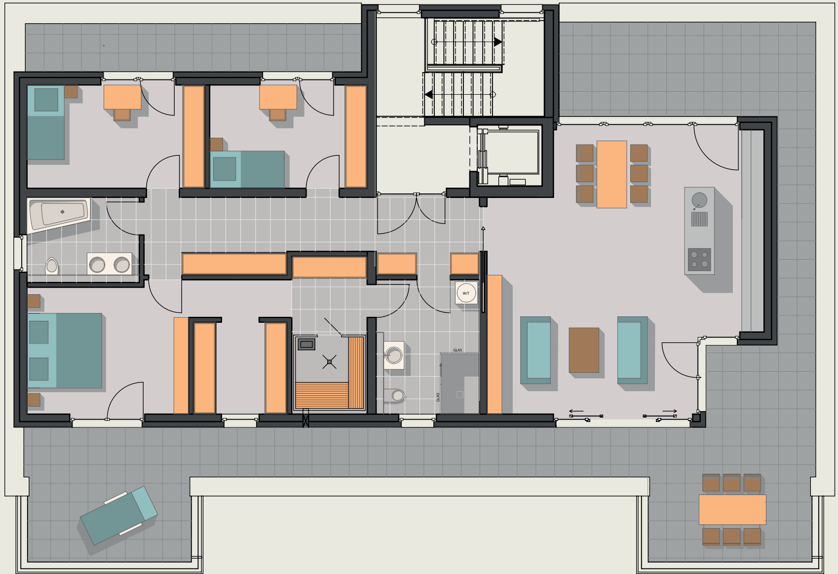
Haus 4, Wohnung 4.6, 188 m 2