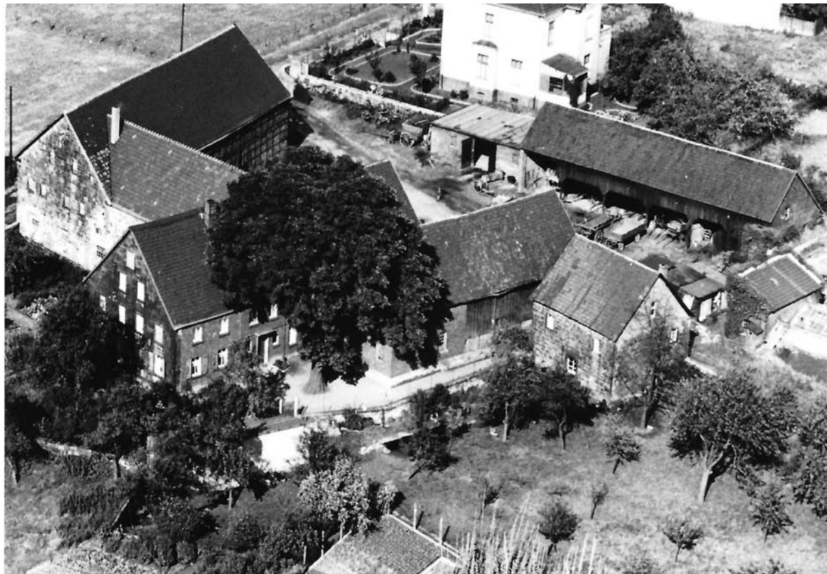
Hof Schlenkermann 1950