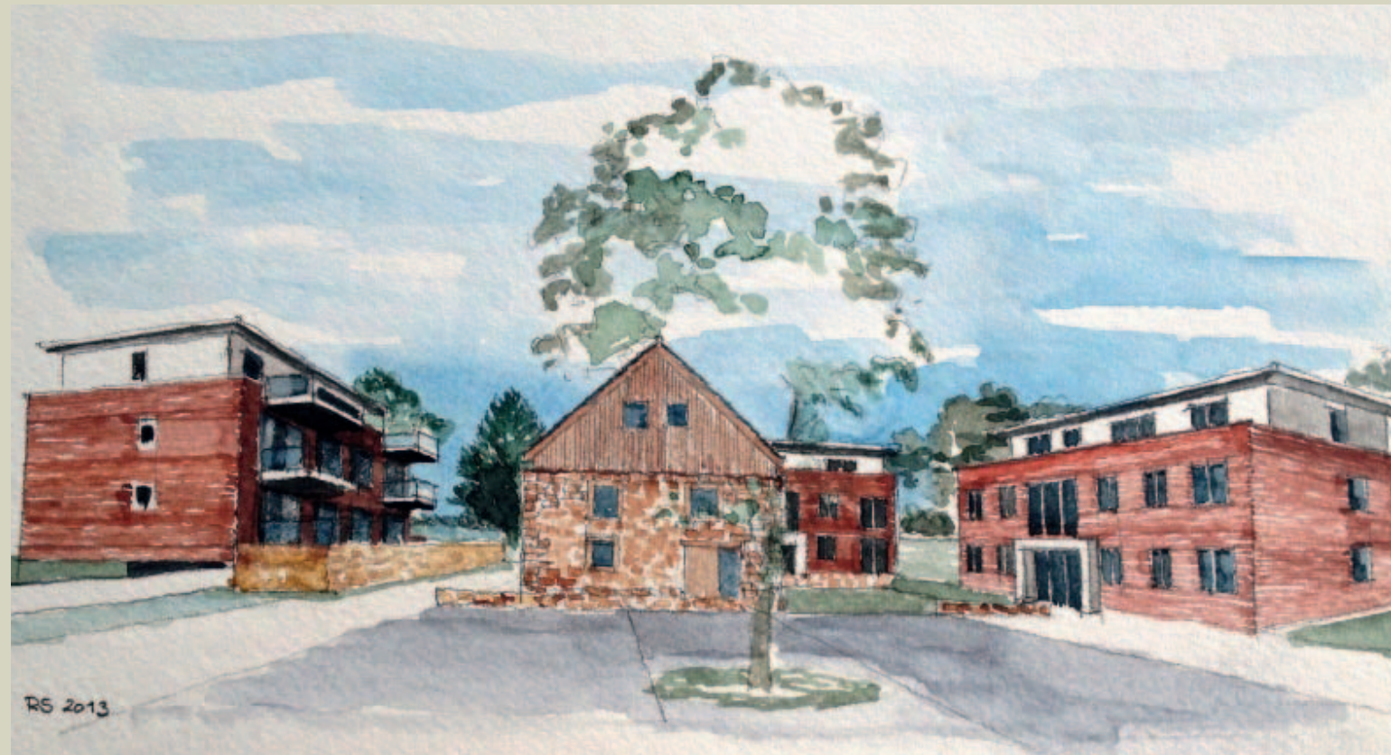
Modernes Quartier auf historischem Grund