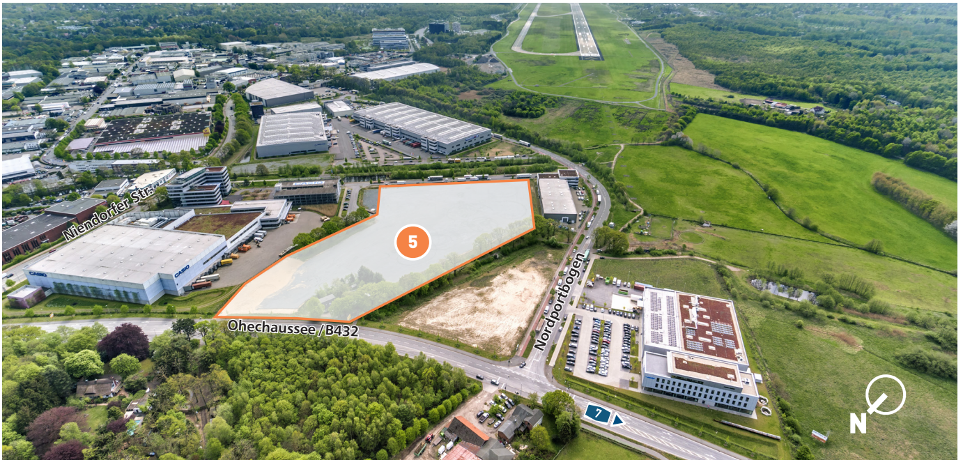
Blick auf die noch verfügbare Fläche im Norden des NORDPORT (B245)