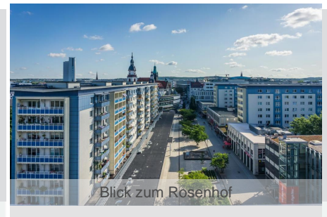
Blick zum Rosenhof