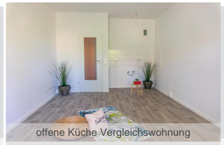
offene Küche Vergleichswohnung