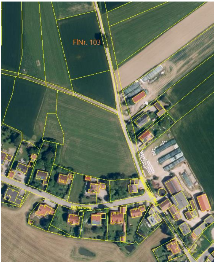
© BVV – Luftbild und Umgebungsplan