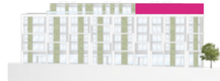
Haus A - Ansicht Süd