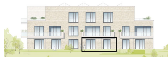
Villa 5 Ansicht Süd

Keine zusätzliche Maklerprovision für den Erwerber.