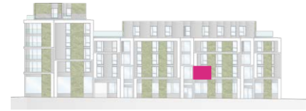
Haus B - Ansicht Ost