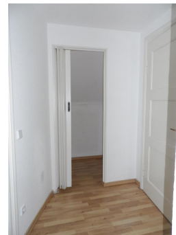
Flur - Abstellraum

ACHTUNG! Der Esstisch und die Couch im Wohnzimmer, sowie die braune Kommode im