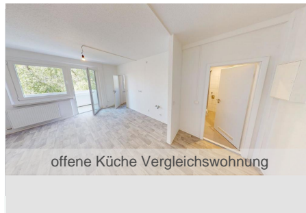
offene Küche Vergleichswohnung