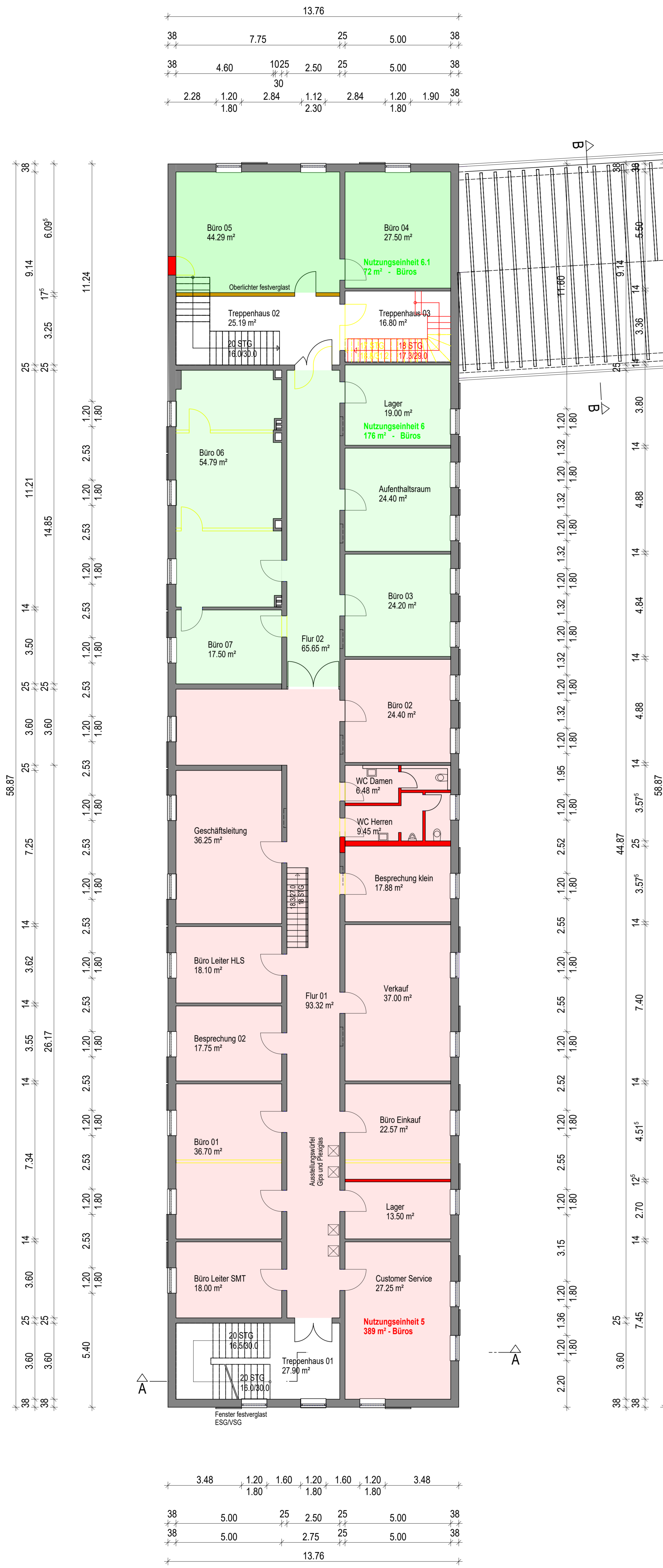
1. OBERGESCHOSS GEBÄUDE 5