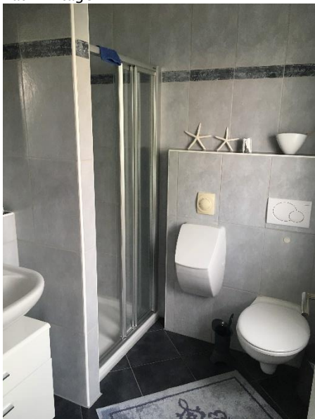
Gästebad mit Dusche