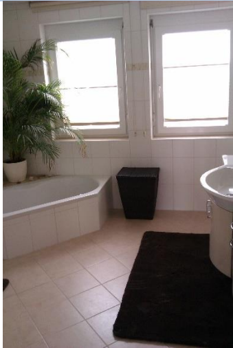
Bad 1. Etage