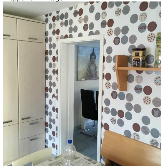
Schiebetüre zwischen Küche und Wohn- und Essbereich