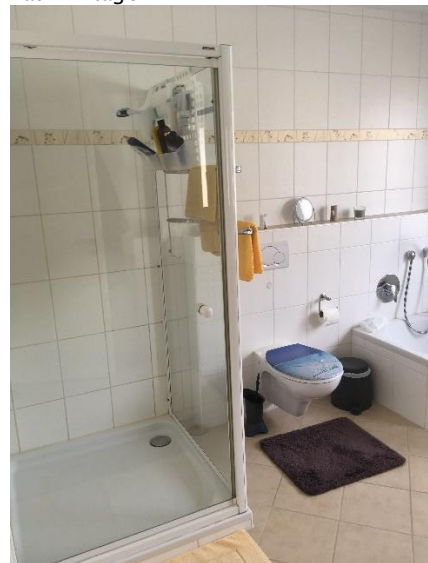
Bad 1. Etage