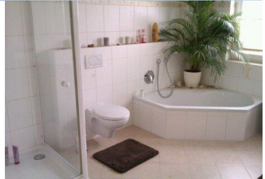
Bad 1. Etage