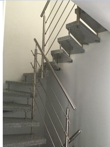
Treppe zur 1. Etage