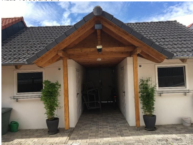
2 Einzelgaragen mit Durchgang zur Parallelstraße hinter dem Anwesen, Zufahrt in Garagen durch Parallelstraße hinter dem Anwesen