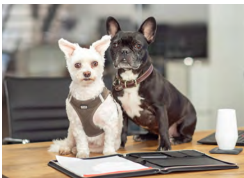
RUBI & BELLA