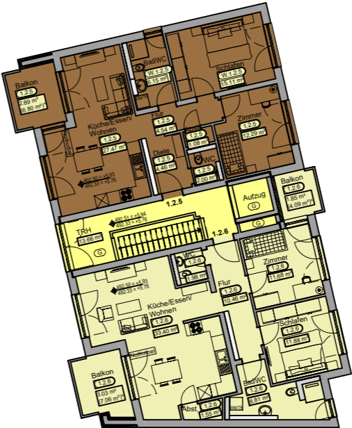
2. Obergeschoss Haus 1 Hausnummer 1c