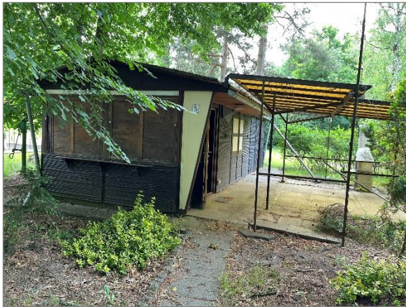
Abbildung 3: Bungalow mit Terrasse