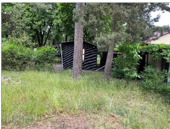
Abbildung 7: Blick Richtung Straße