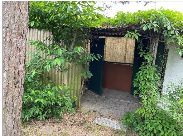
Abbildung 4: Schuppen mit Anbau