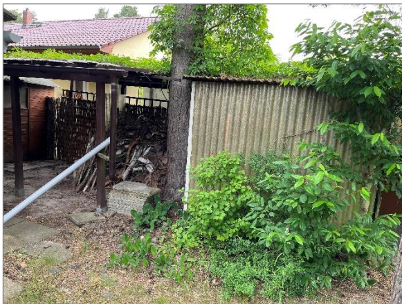
Abbildung 5: Schuppen