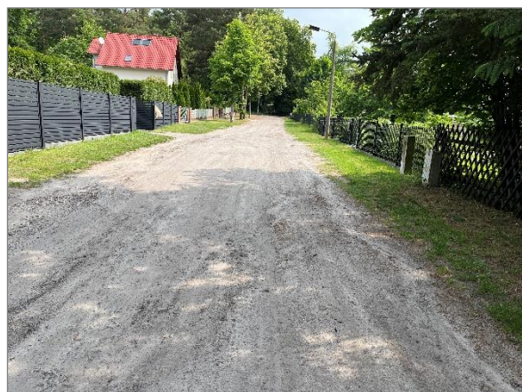
Abbildung 8: Blick in die Straße „Am Stujangsberg“