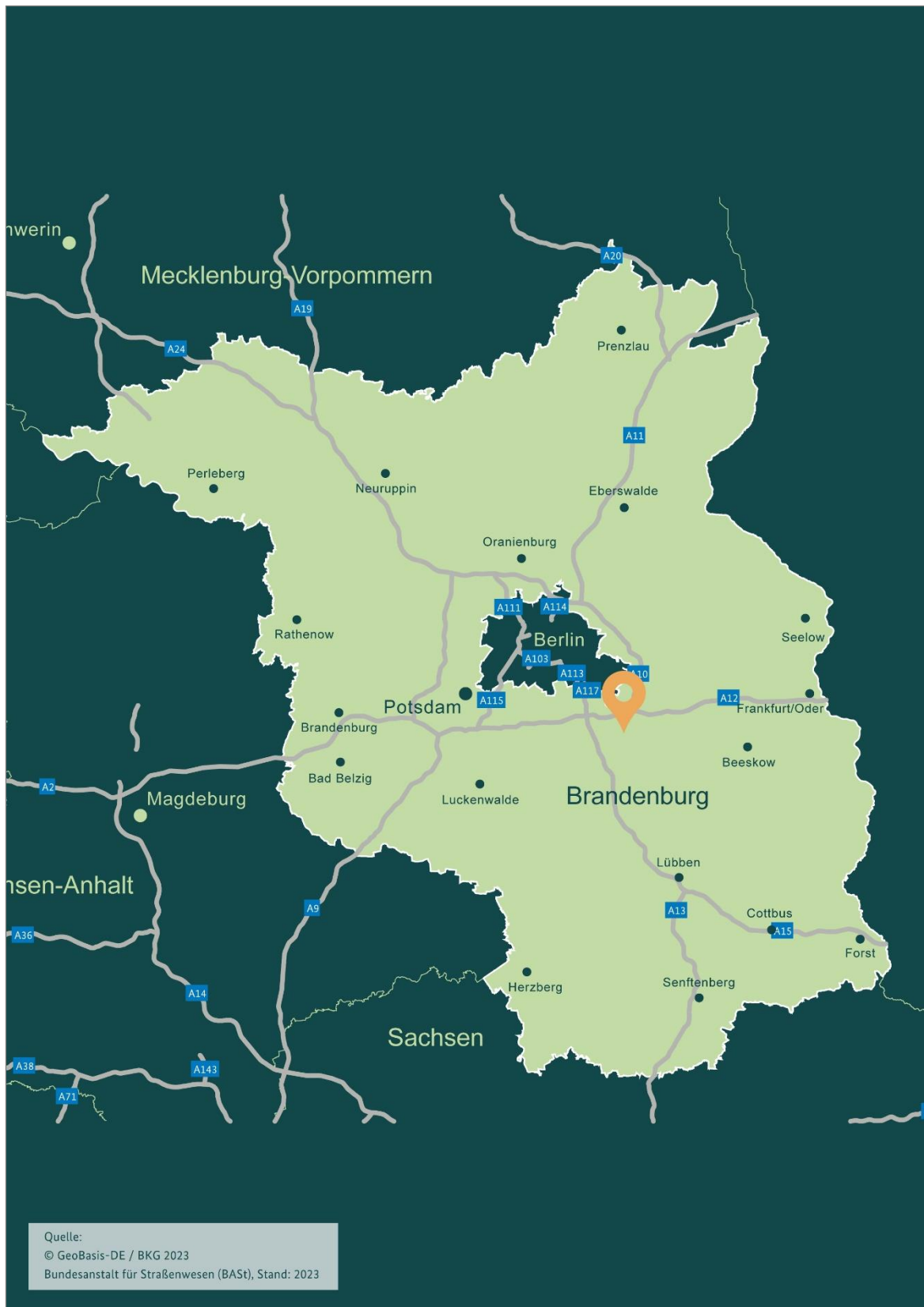
Abbildung 1: Lage im Land Brandenburg