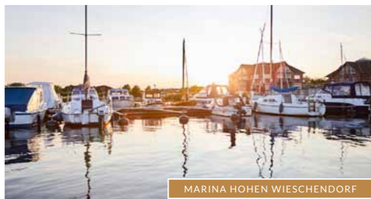
MARINA HOHEN WIESCHENDORF