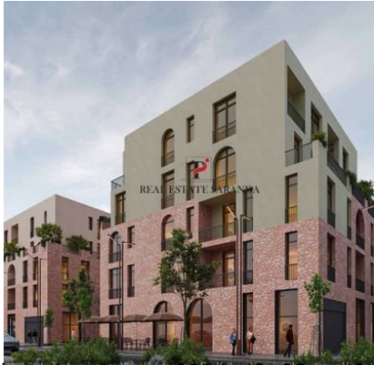
WhatsApp image 2024-12-09 at 12:15.42 (3).jpeg