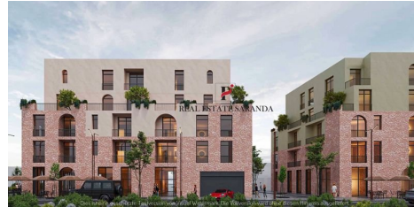
WhatsApp Image 2024-12-09 at 12.15.42 (4).jpeg