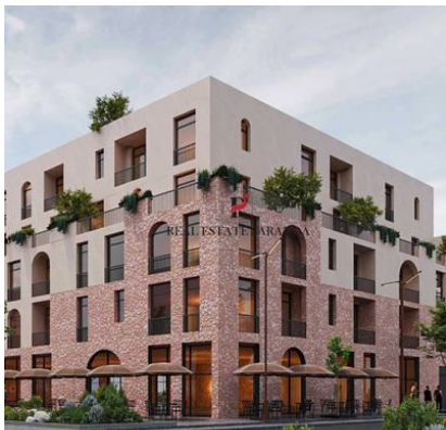
WhatsApp image 2024-12-09 at 12:15.42 (5).jpeg