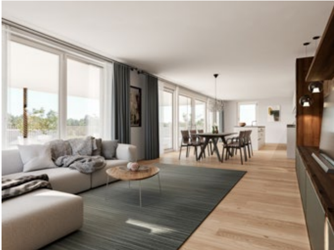
Durchdachte Raumaufteilung in den Wohnungen