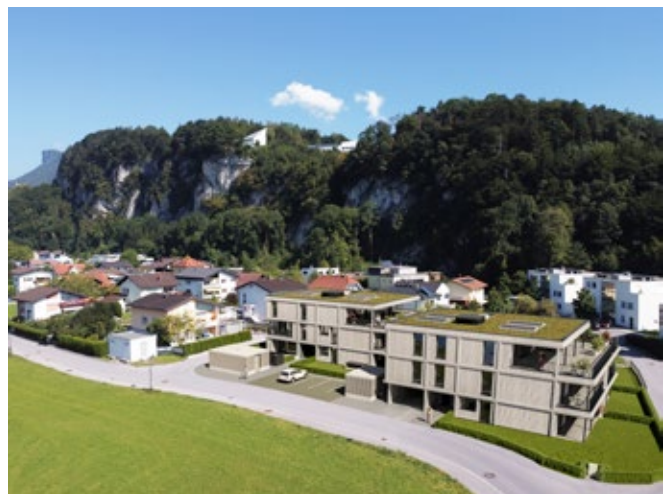
Die Wohnanlage fügt sich auf elegante Weise ins Landschaftsbild ein.