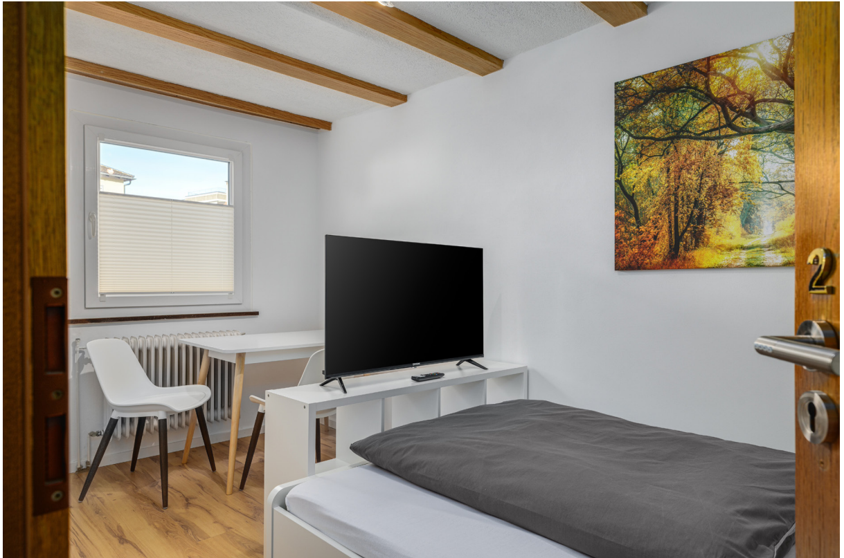
Zimmer 2 im 1.OG