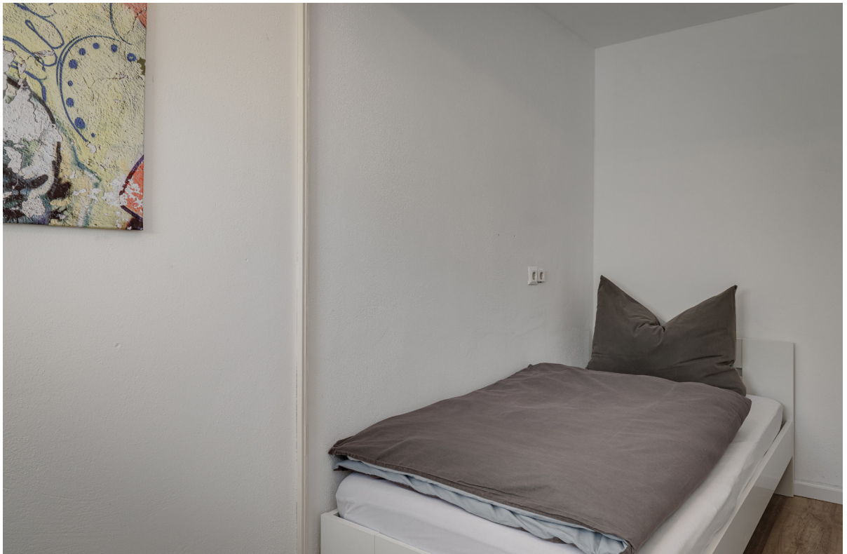
Zimmer 3 im 1.OG