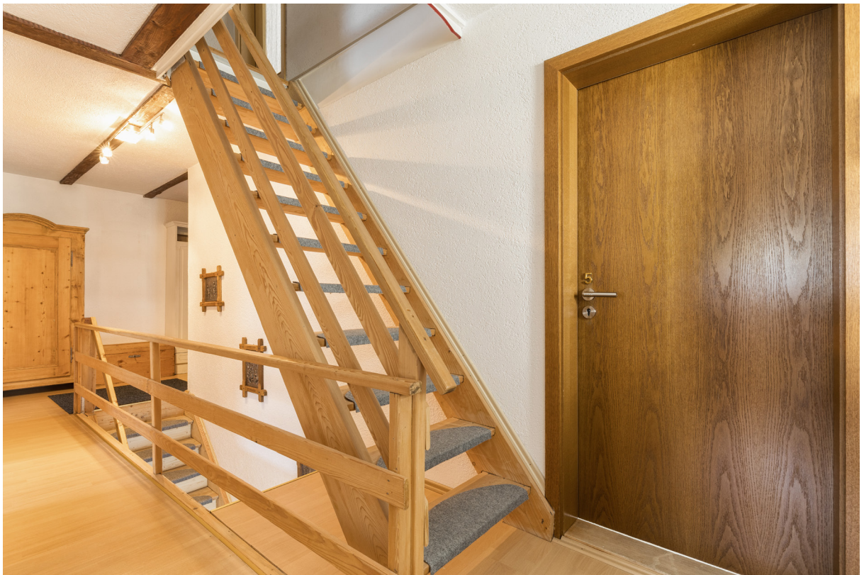
Diele im 1.OG