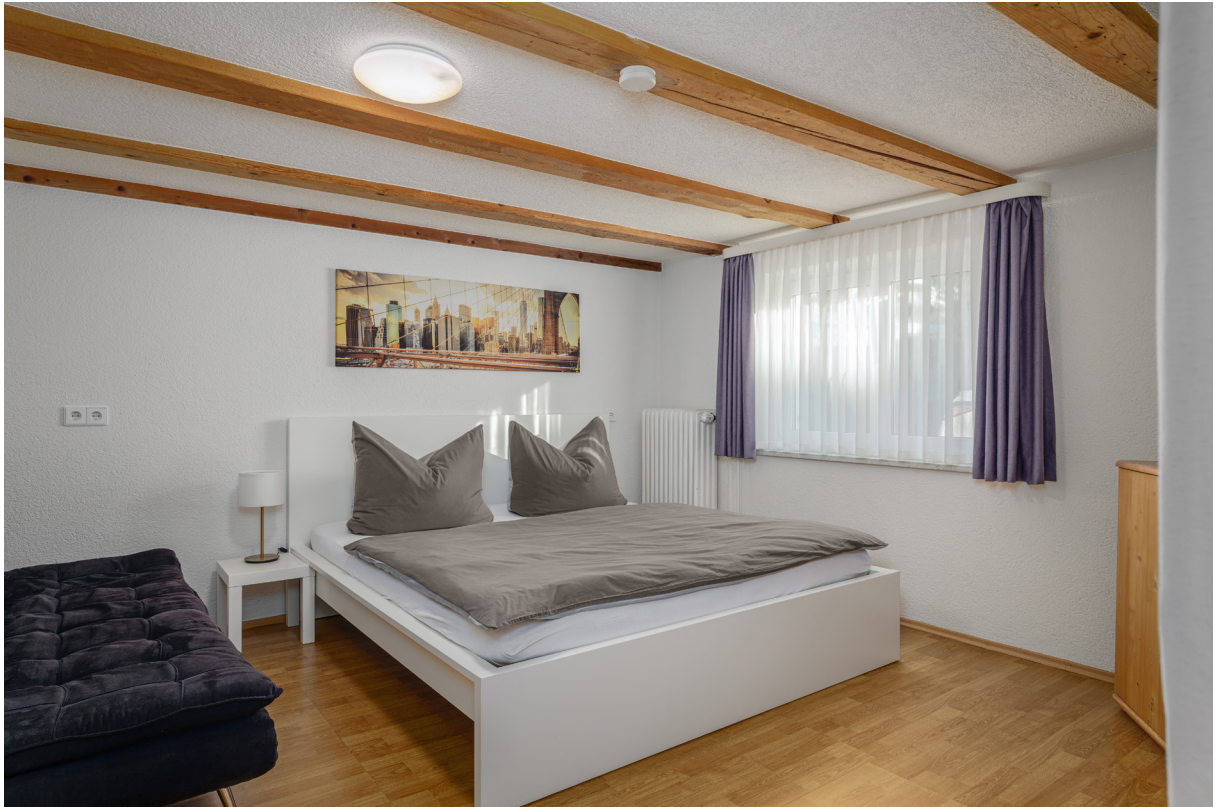
Zimmer Apartment EG