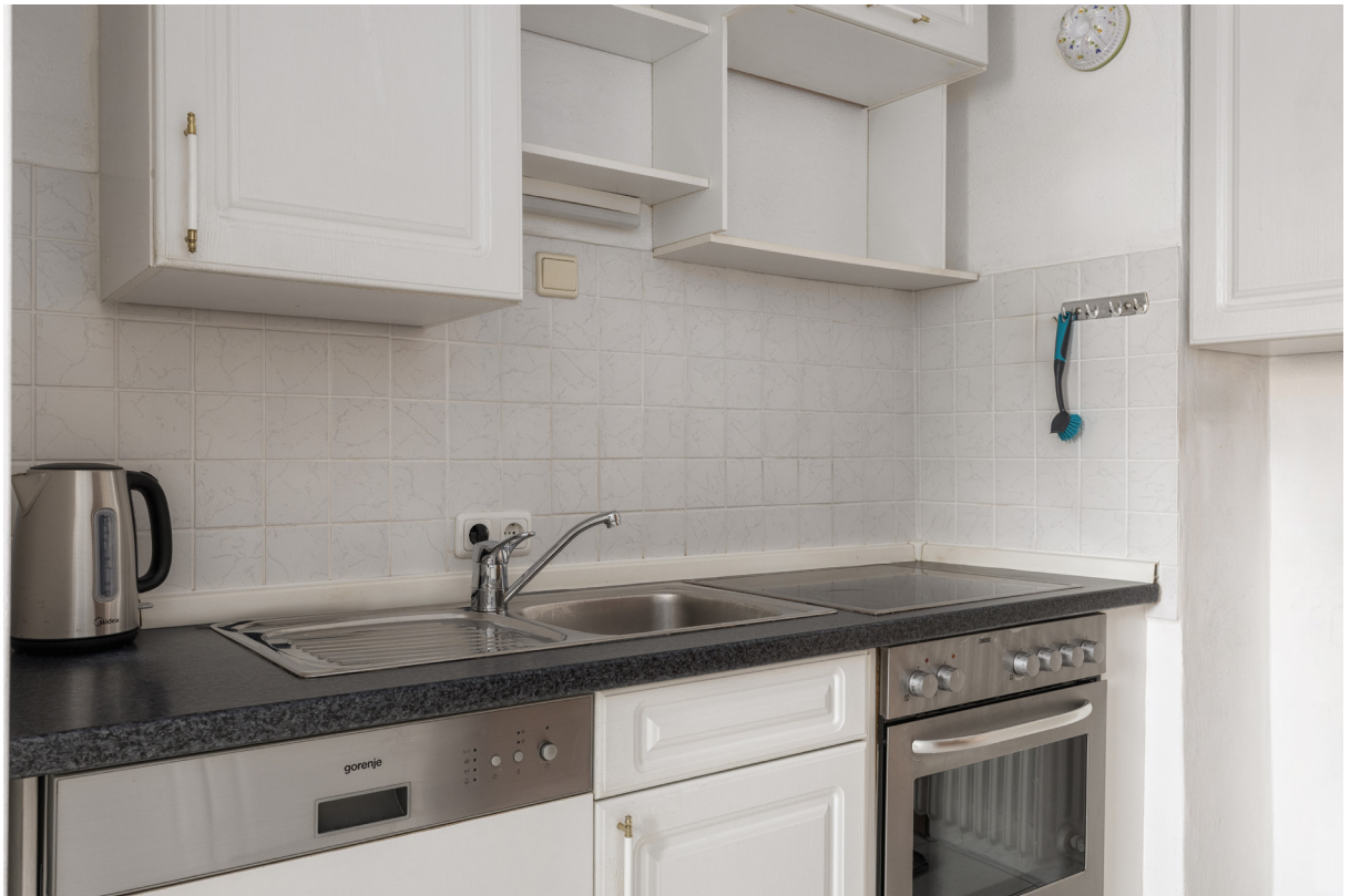
Kochen Detail im 1.OG