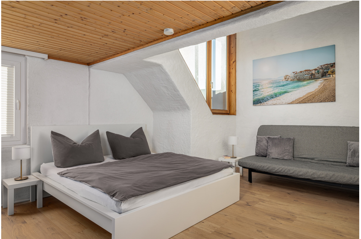
Zimmer 7 im 2.OG