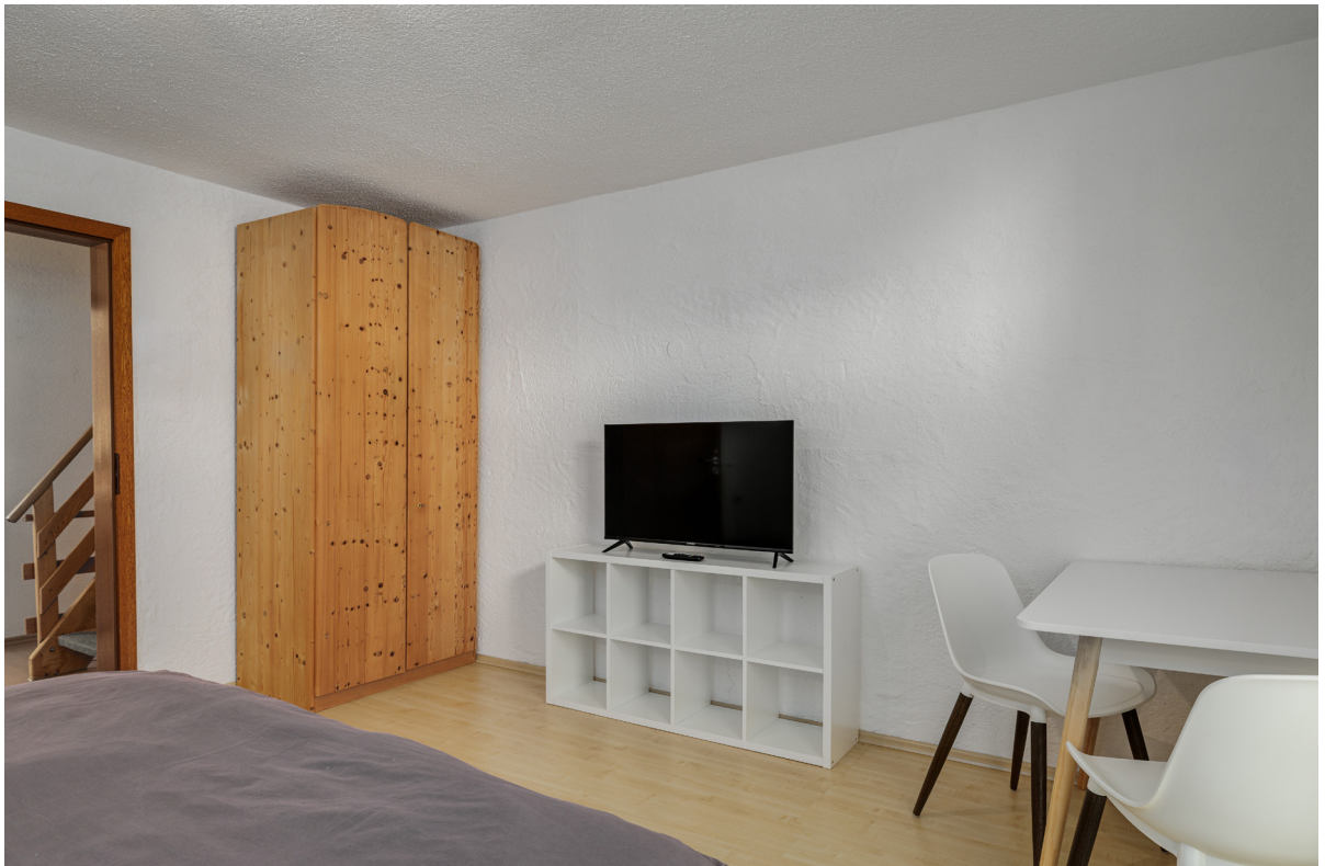
Zimmer 5 im 1.OG