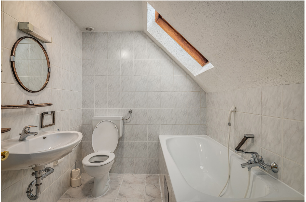
Bad im 2.OG