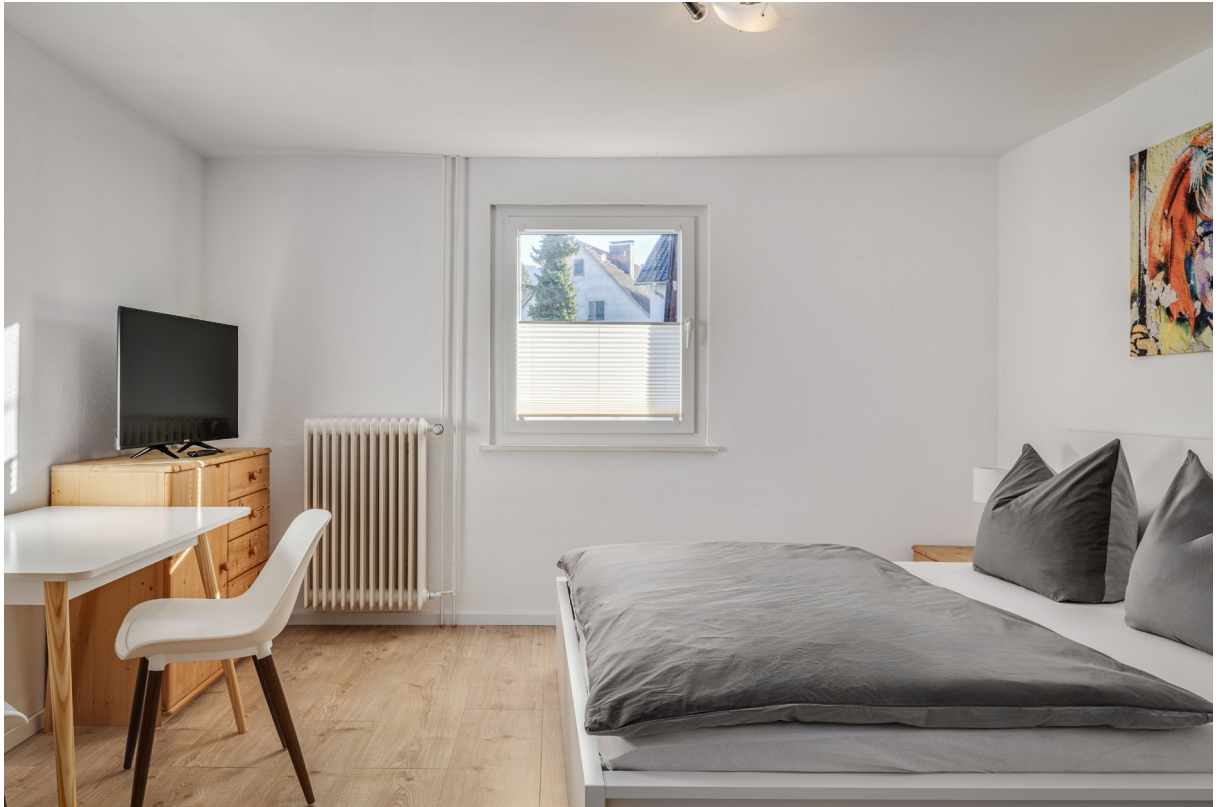
Zimmer 4 im 1.OG