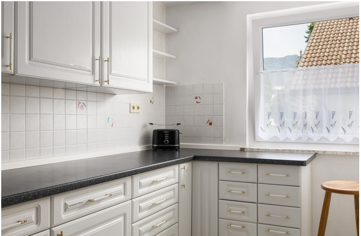
Kochen Detail im 1.OG