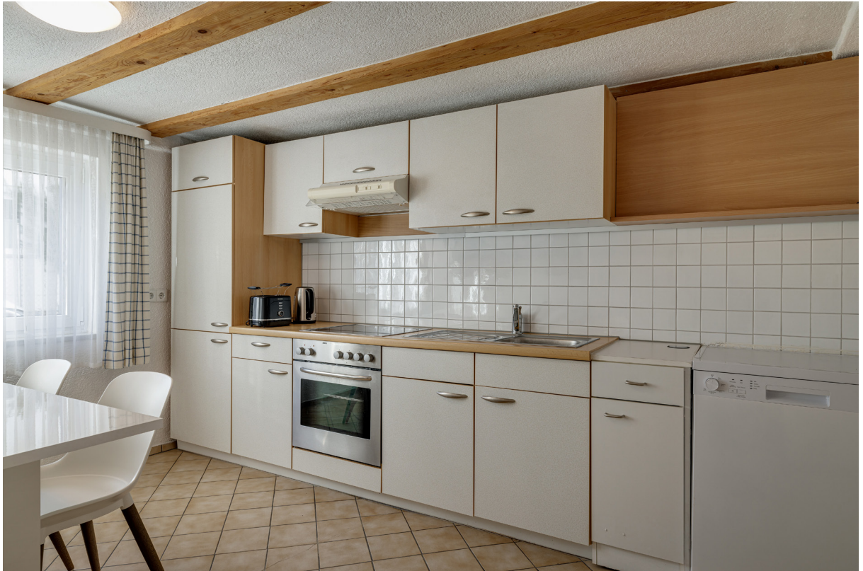
Kochen Apartment EG