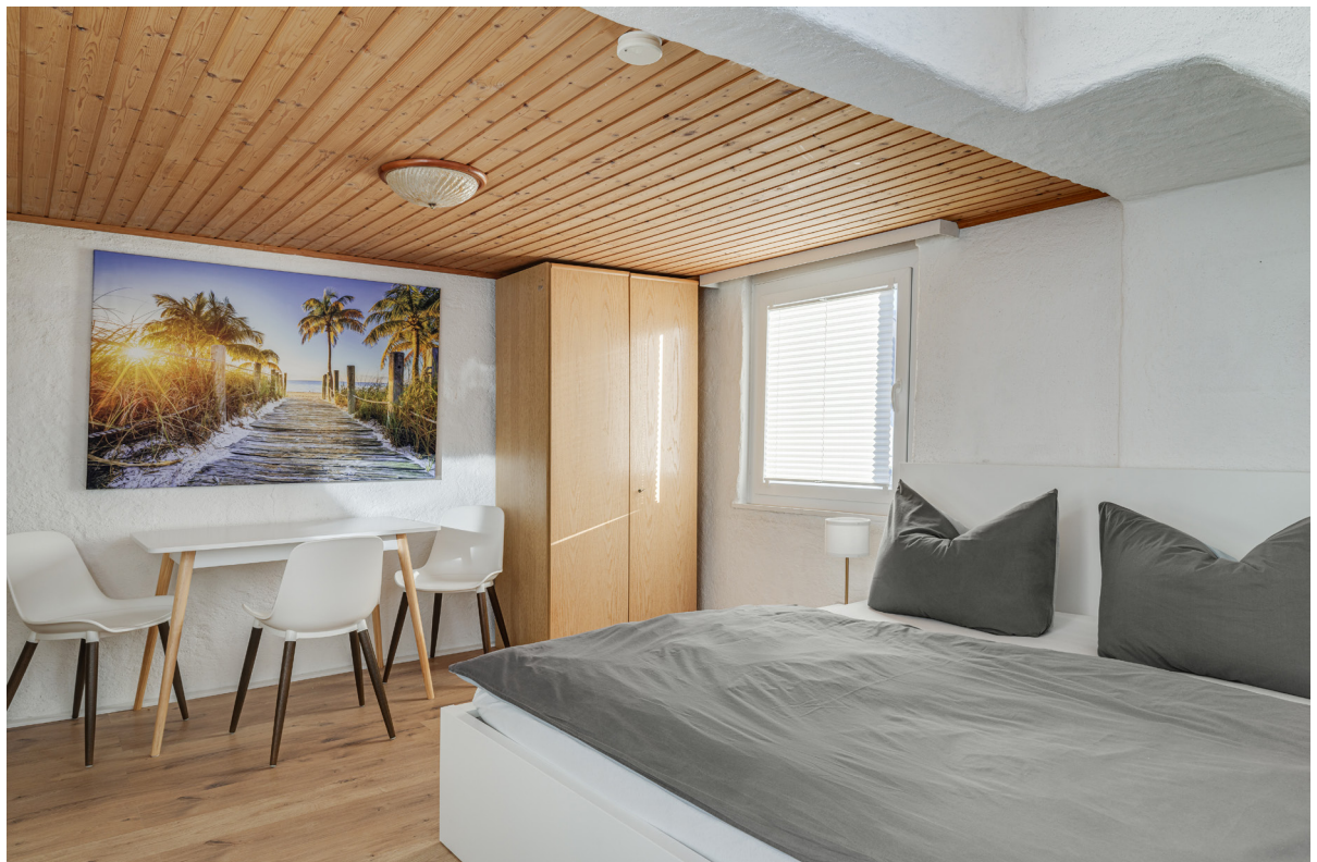
Zimmer 7 im 2.OG