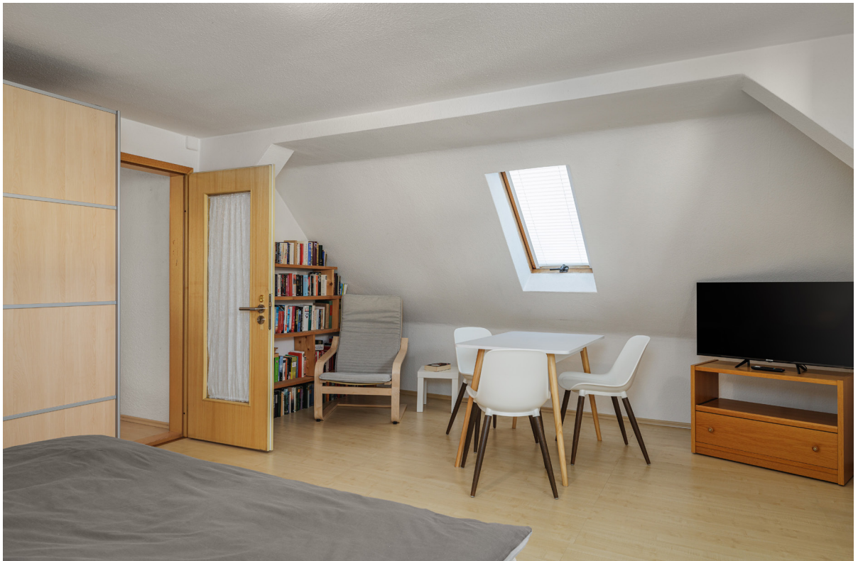
Zimmer 6 im 2.OG