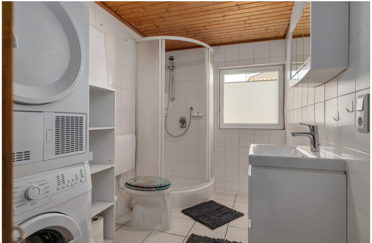
Bad im 1.OG