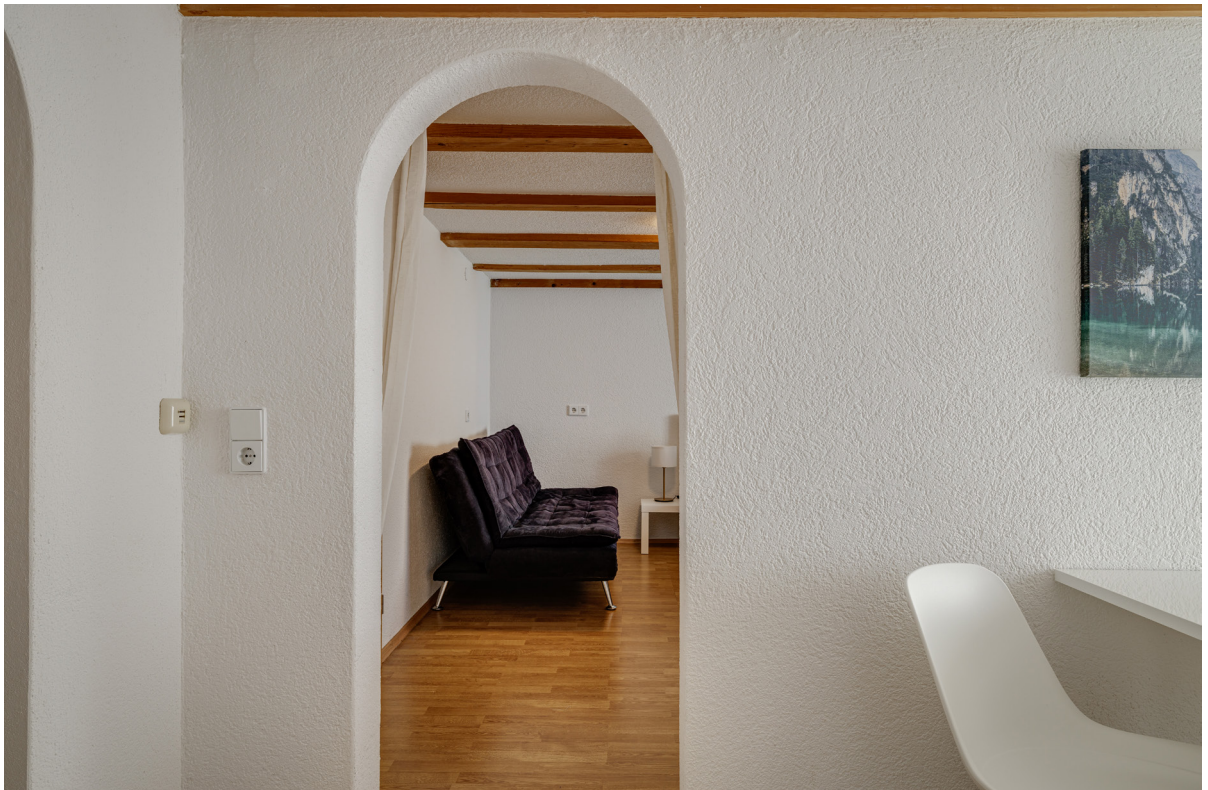
Diele Apartment EG