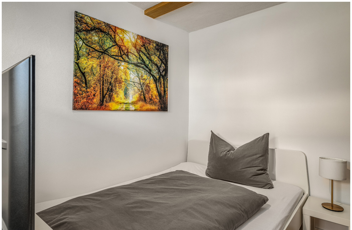
Zimmer 2 im 1.OG