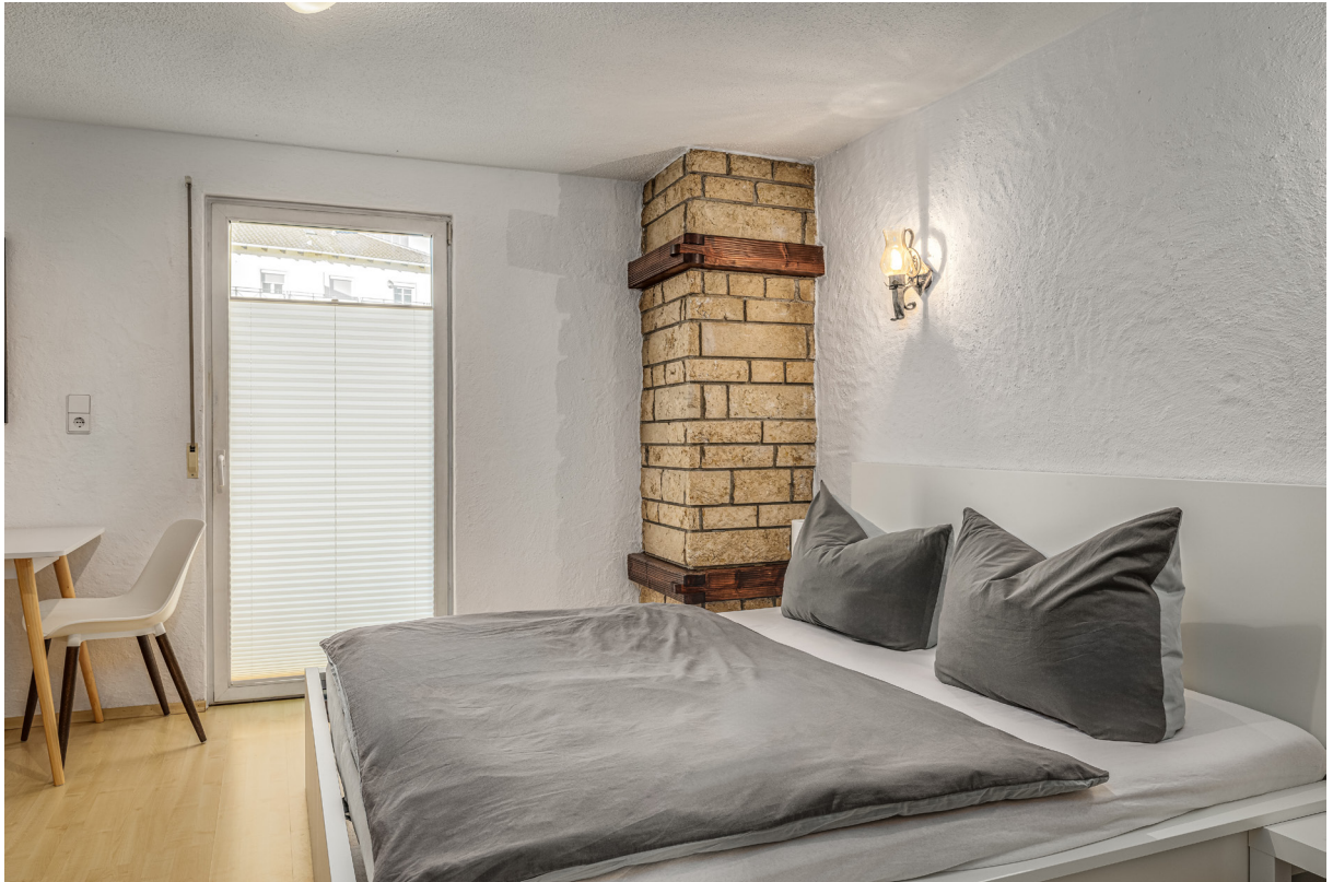
Zimmer 5 im 1.OG