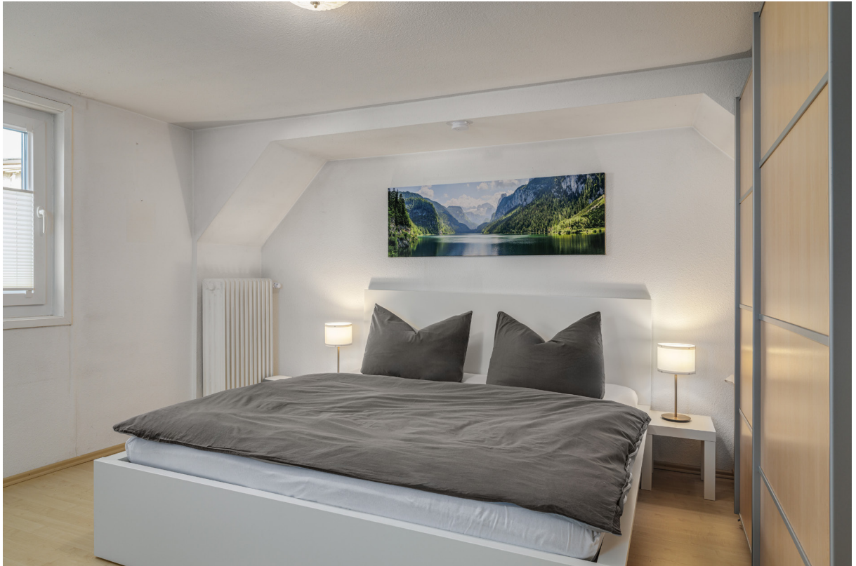
Zimmer 6 im 2.OG