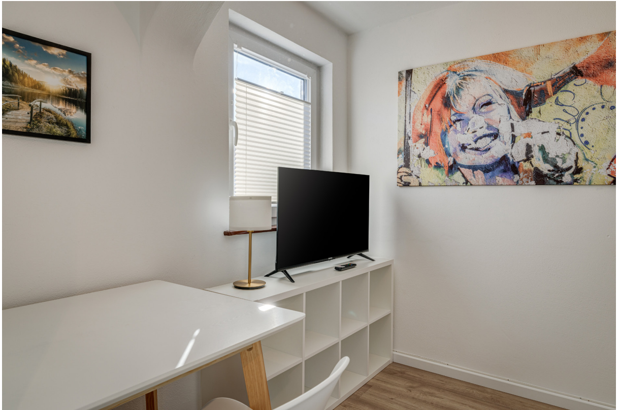
Zimmer 3 im 1.OG