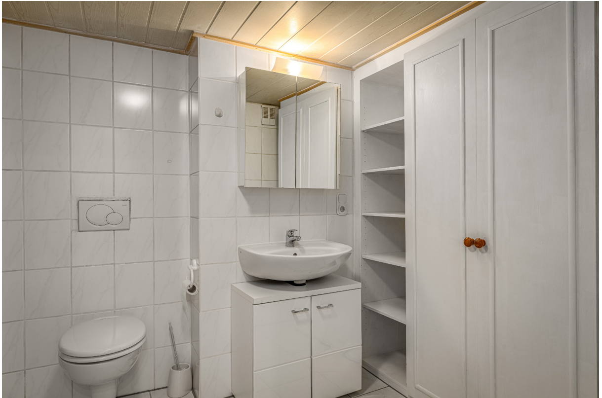
Bad Apartment EG