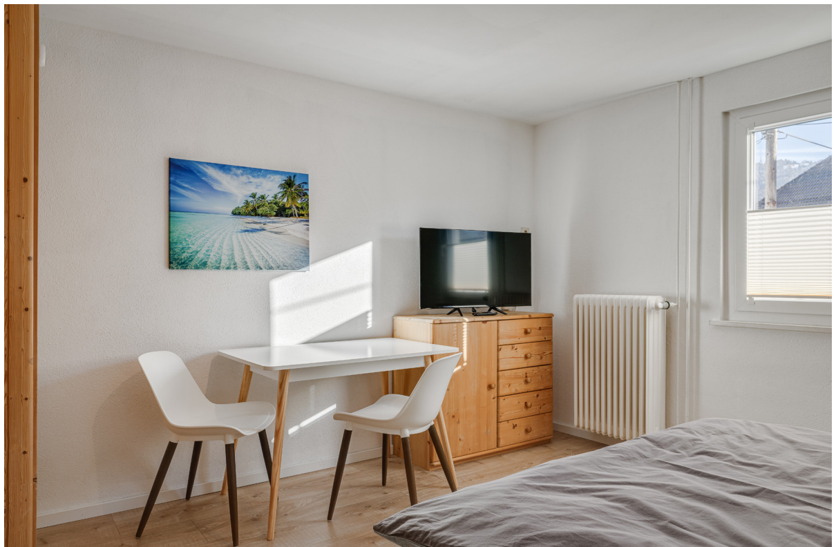
Zimmer 4 im 1.OG