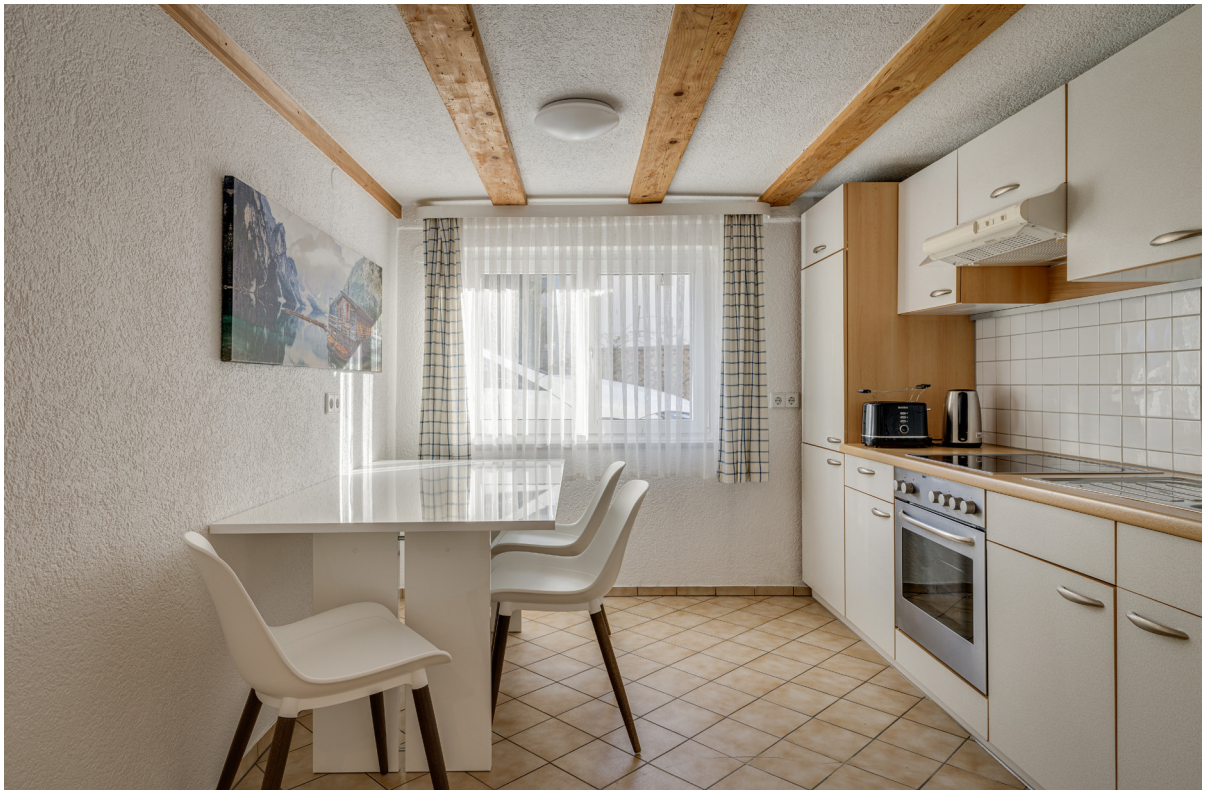
Essen Apartment EG