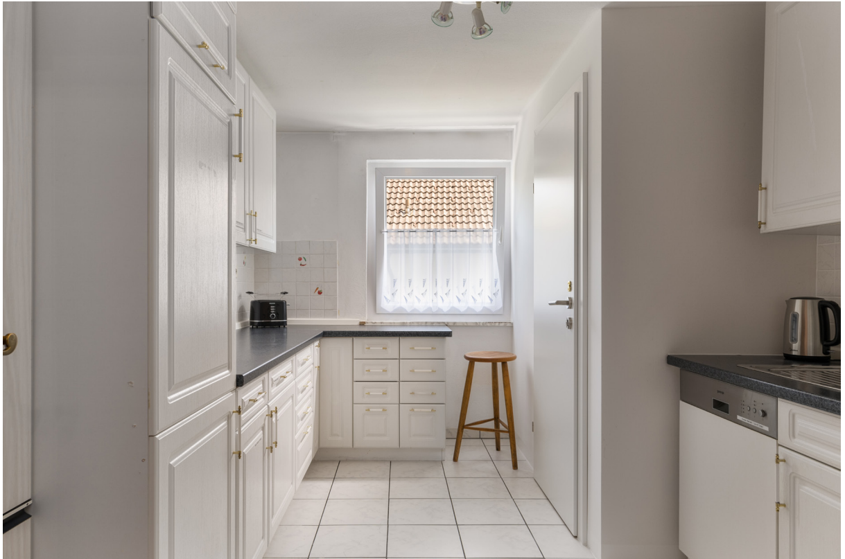
Kochen im 1.OG