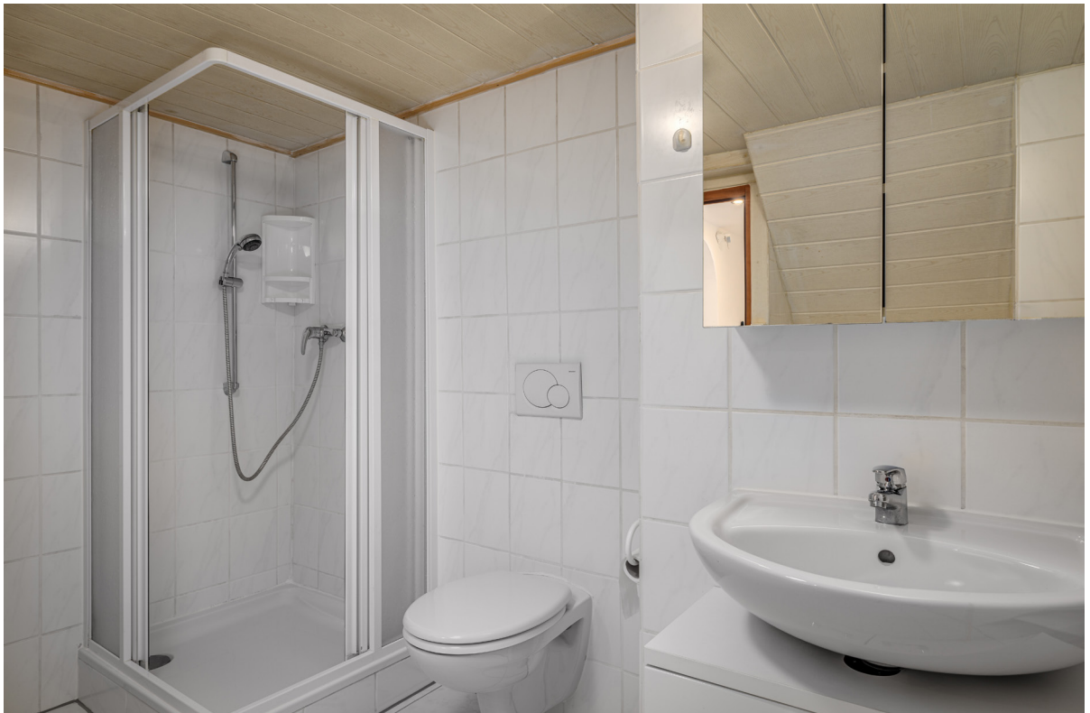
Bad Apartment EG