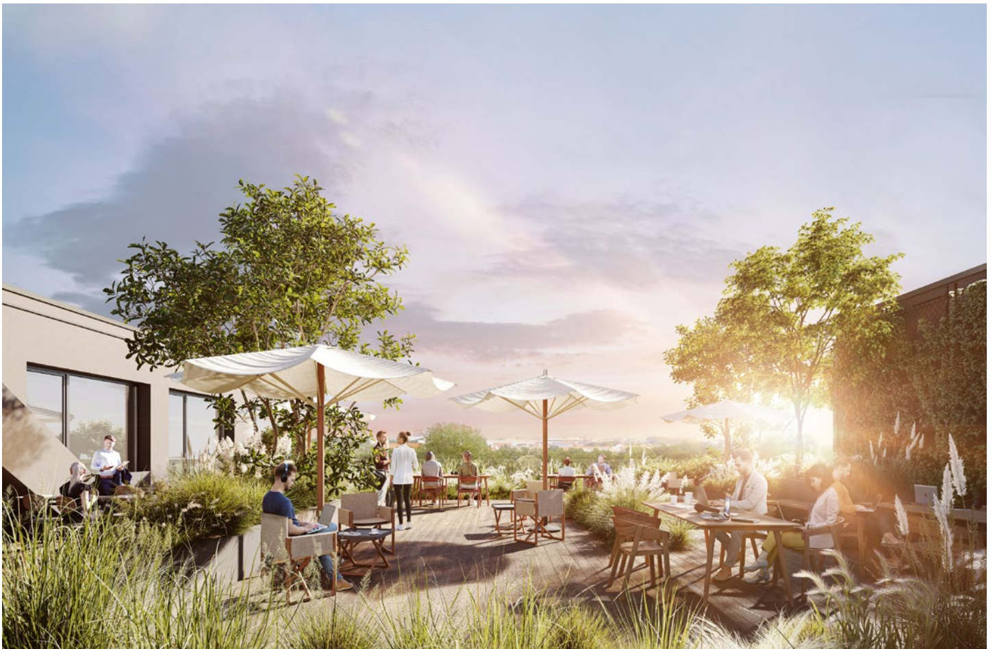
All visualizations and the facilities depicted therein are non-binding and serve illustration purposes only.