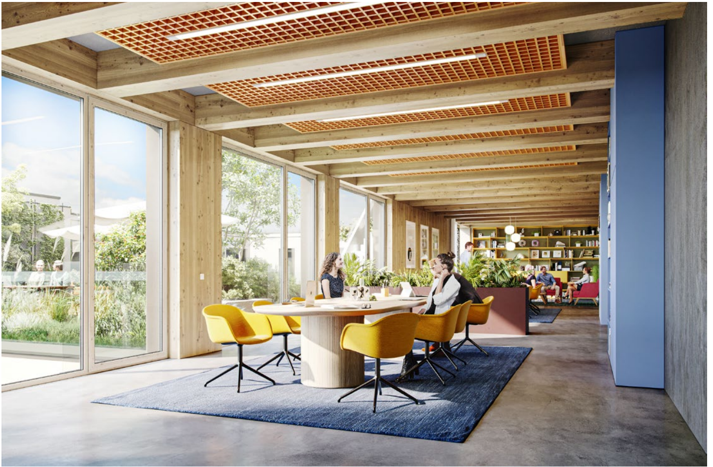
Alle Visualisierungen und die darin dargestellten Einrichtungen sind unverbindlich und dienen Illustrationszwecken.