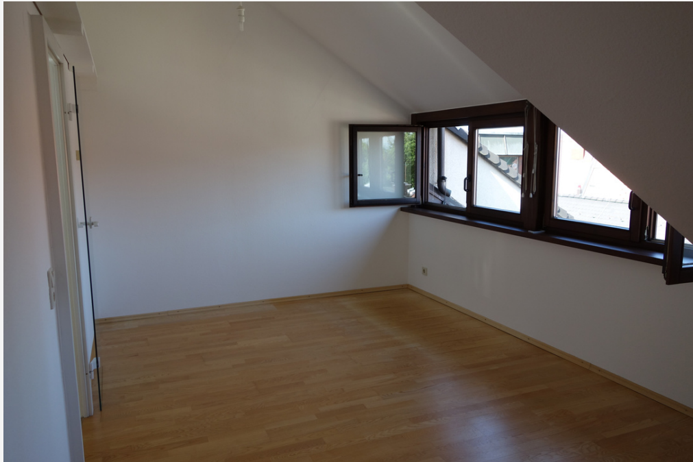
TEIL DES WOHN- UND SCHLAFRAUMES