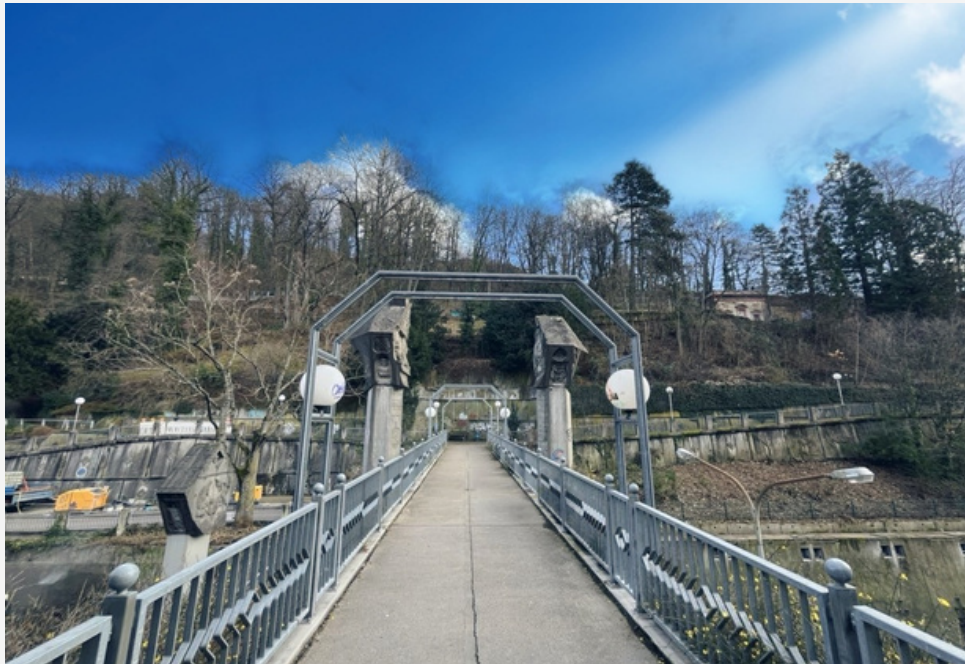
BRÜCKE ZUM SCHLOSSBERG DIREKT VOM HAUS AUS