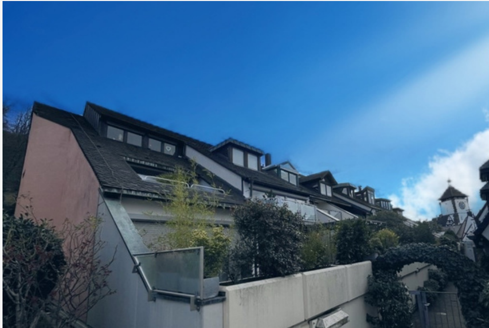
ANSICHT HAUS MIT BLICK AUF SCHWABENTOR