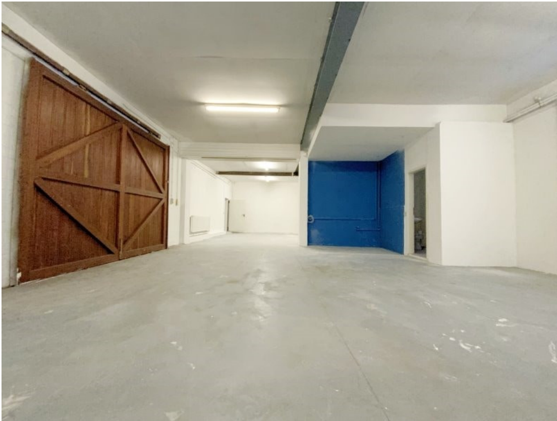
Lagerraum mit Toranlage