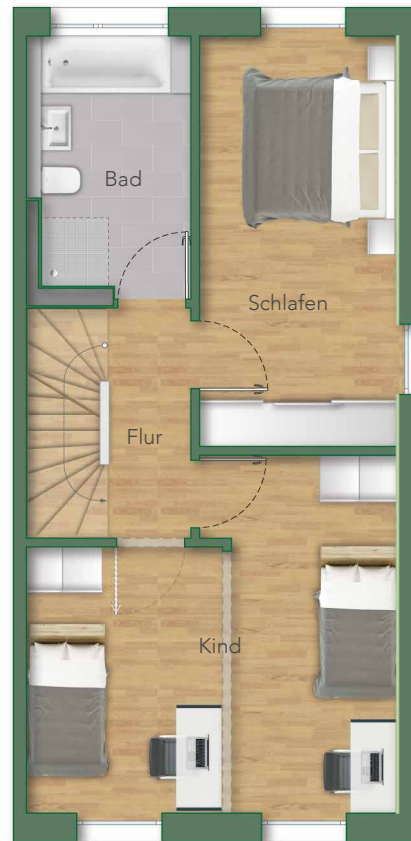
— OG —