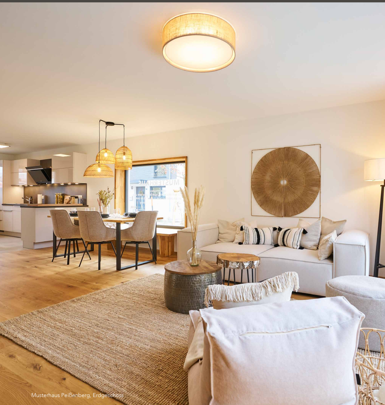
Musterhaus Peißenberg, Erdgeschoss