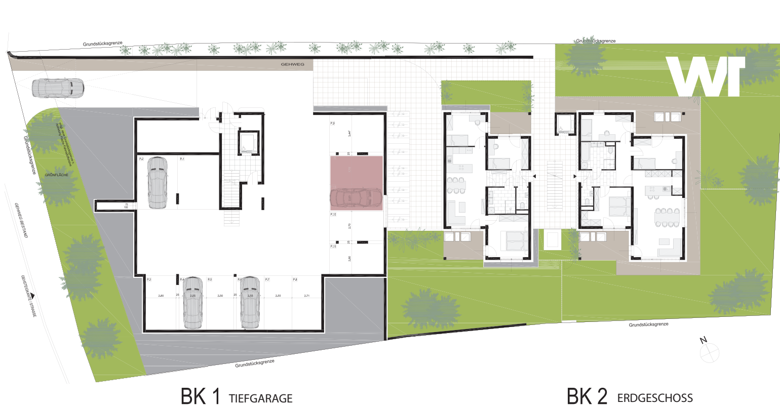
BK 1 TIEFGARAGE