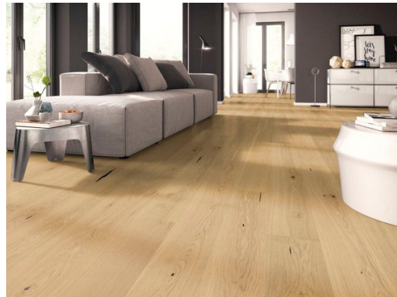
Landhausdielen Eiche kraftvoll, natur geölt