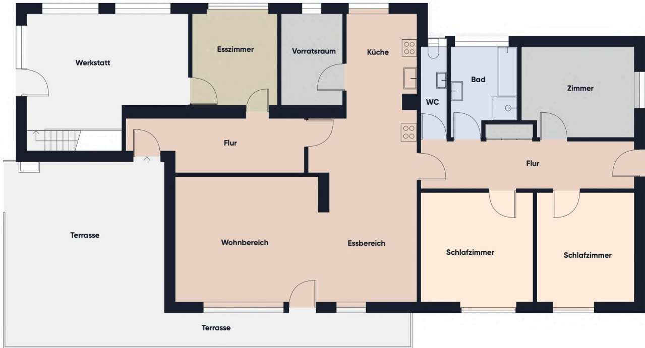
Grundrissplan ohne Maßstab