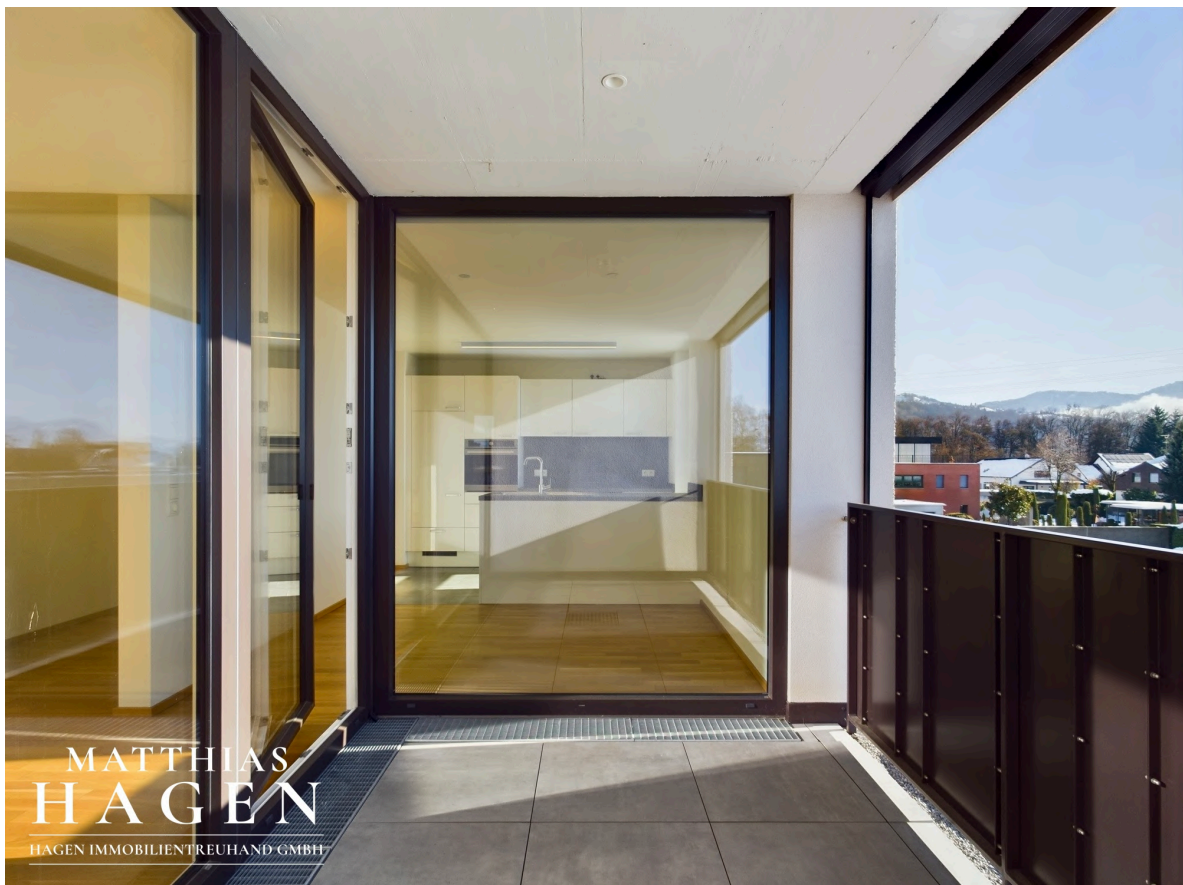
Terrasse mit Blick in die Küche