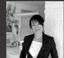
SWEA DECHANGE VERTRIEB

0171 5485153 sandra.vonlobenstein@tecklenburg-bau.de