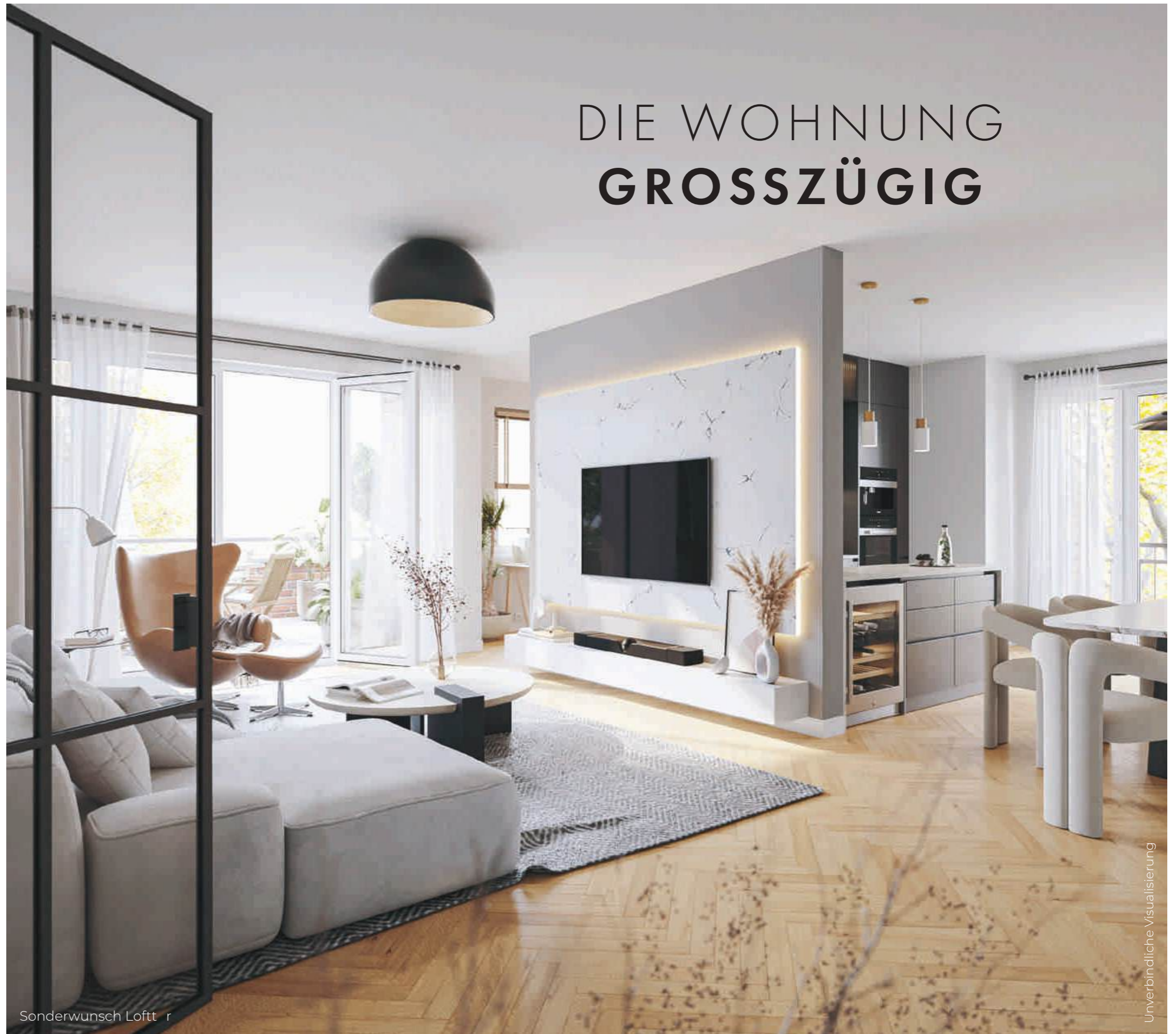
Sonderwunsch Loft r