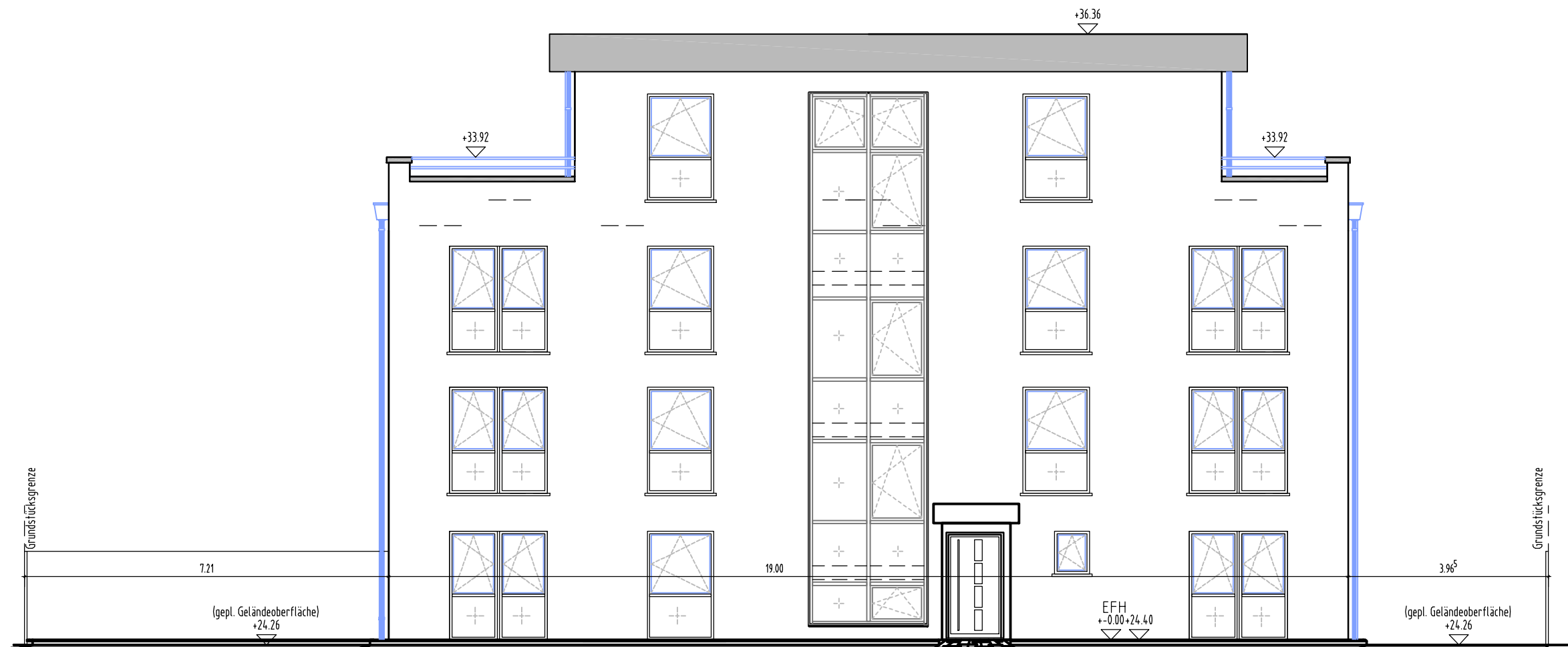
STRASSENANSICHT ( Nord - West )