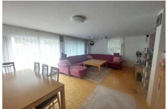
Wohnen Top 1