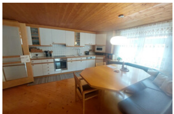
Kochen / Essen Top 2