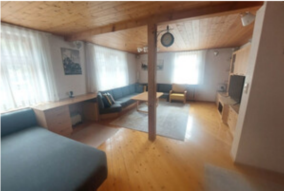
Wohnen Top 2