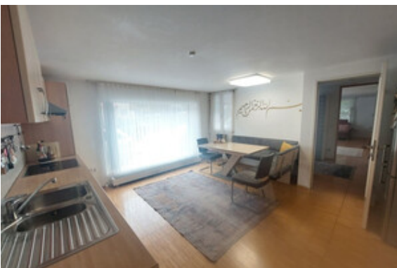
Essen / Kochen Top 1