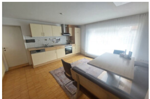
Kochen Top 1