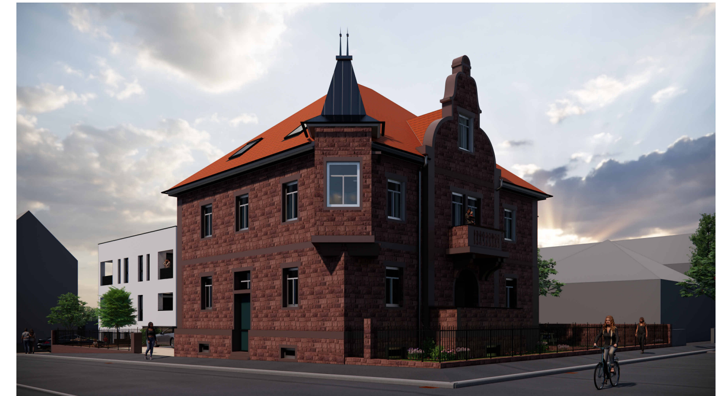
Obergeschoss | WE 03 | 70m 2