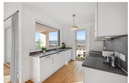
Küche - Muster