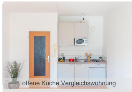
offene Küche Vergleichswohnung