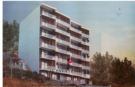
20230628_160350 - Copy.jpg