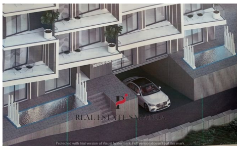
20230628_160438 - Copy.jpg