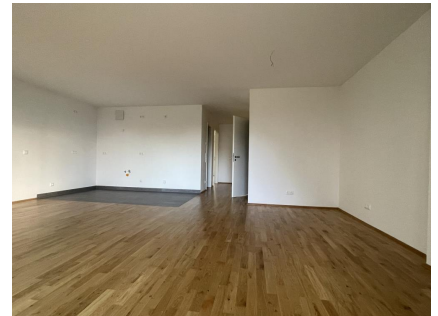
offenes Wohnzimmer Blick zur Küche

Sehr geehrte Interessenten, vielen Dank für Ihr Interesse an unserem Objekt! Gerne stehen wir Ihnen für einen ausführlichen und