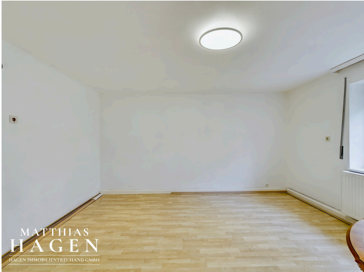
Zimmer 4 EG