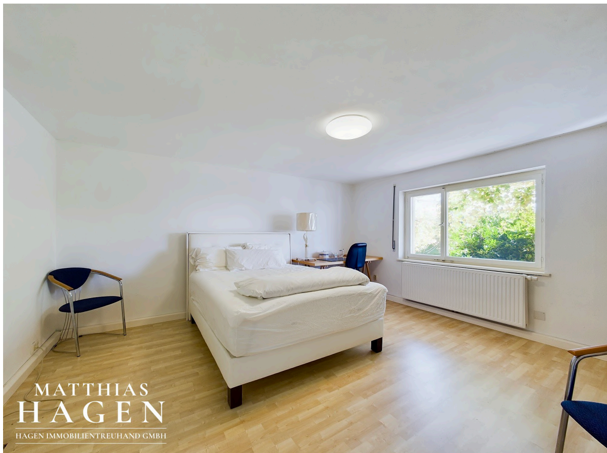
Zimmer 3 EG