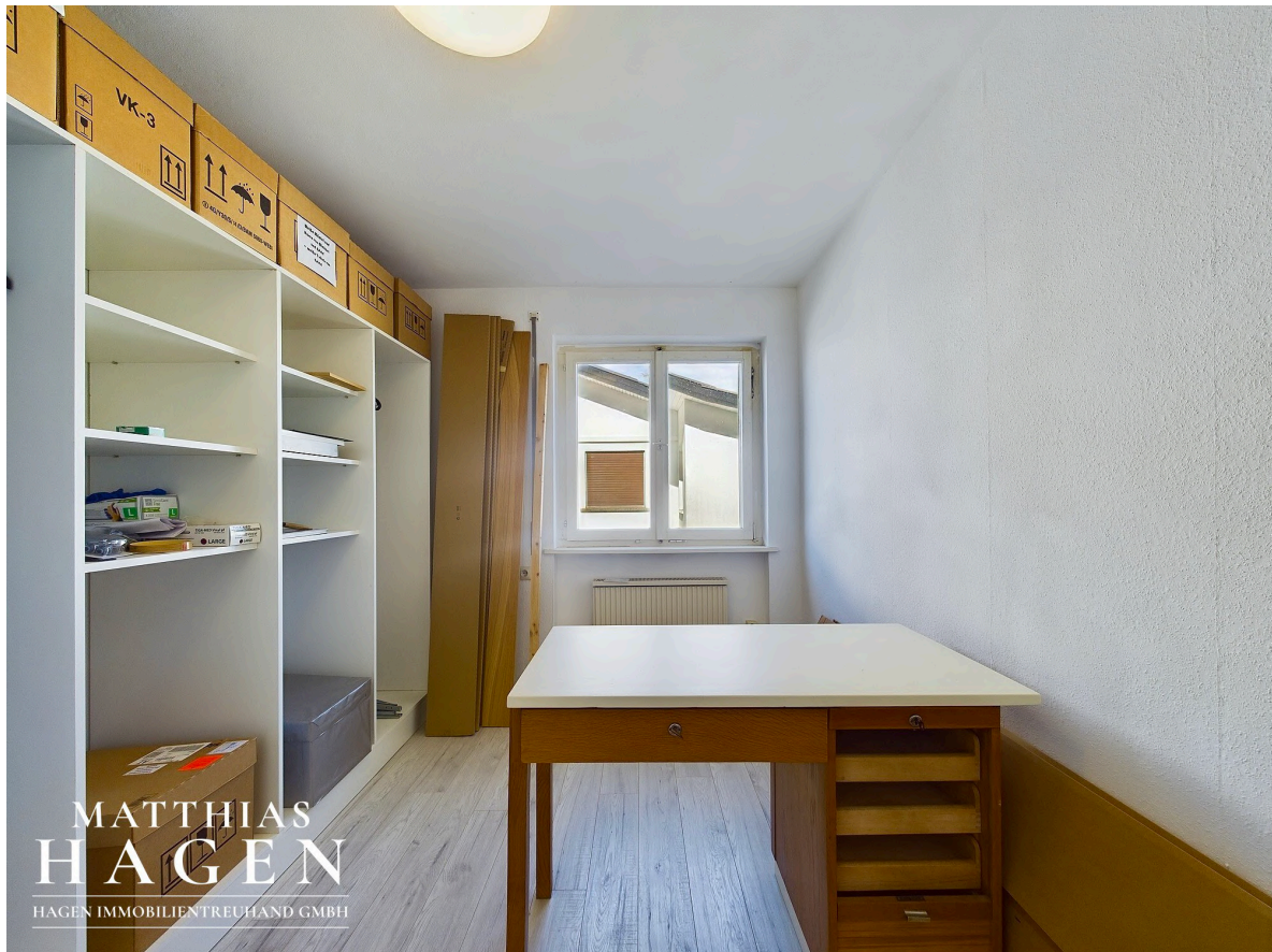
Zimmer 2 OG