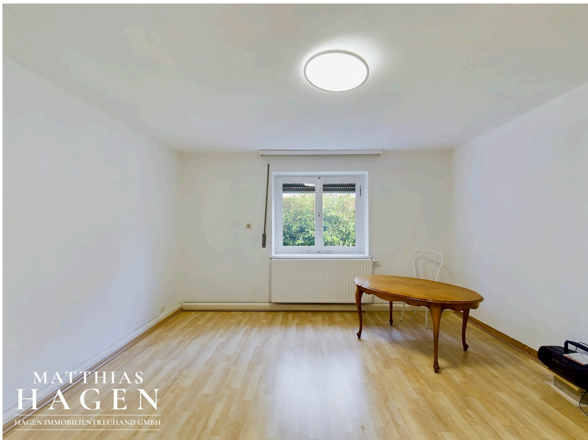
Zimmer 3 EG