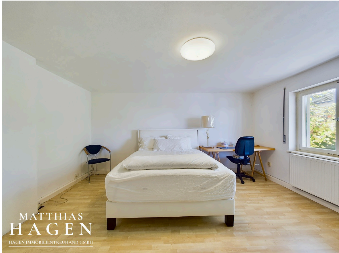
Zimmer 3 EG