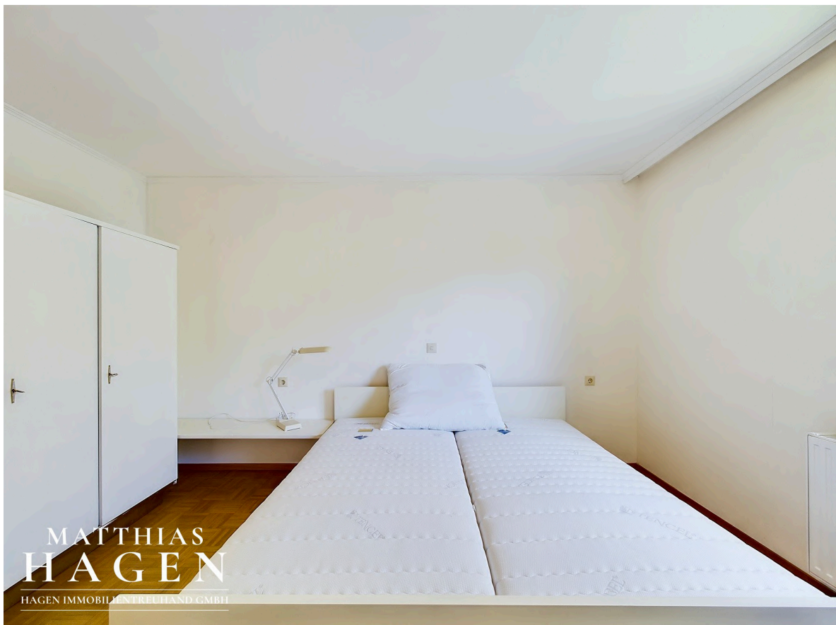
Zimmer 1 OG