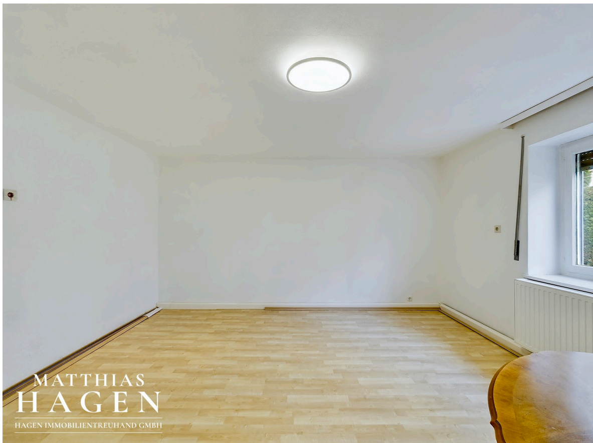
Zimmer 4 EG