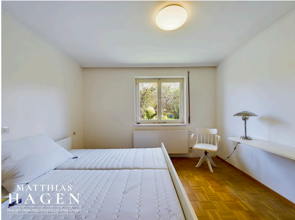
Zimmer 1 OG