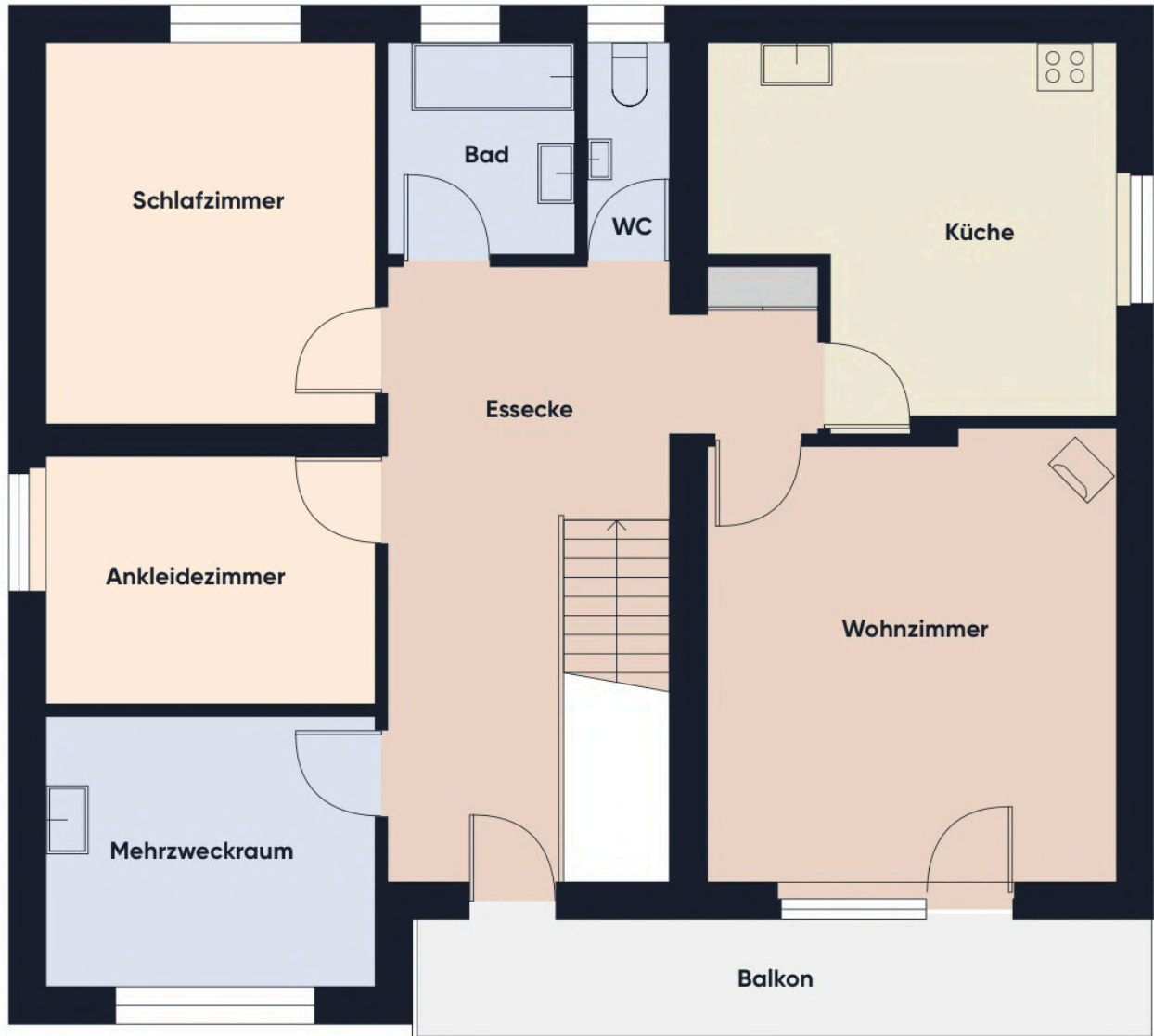
Grundriss OG ohne Maßstab