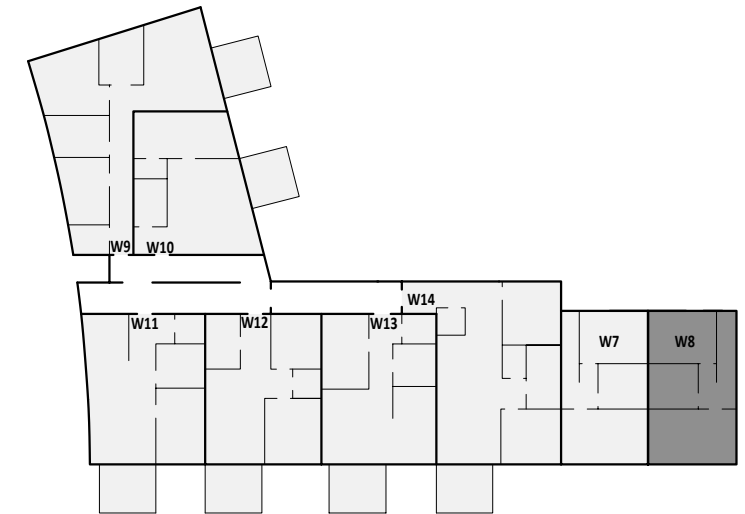
Übersicht 1. Obergeschoss