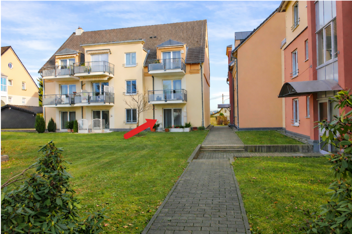
Innenhof mit Wohnungssicht