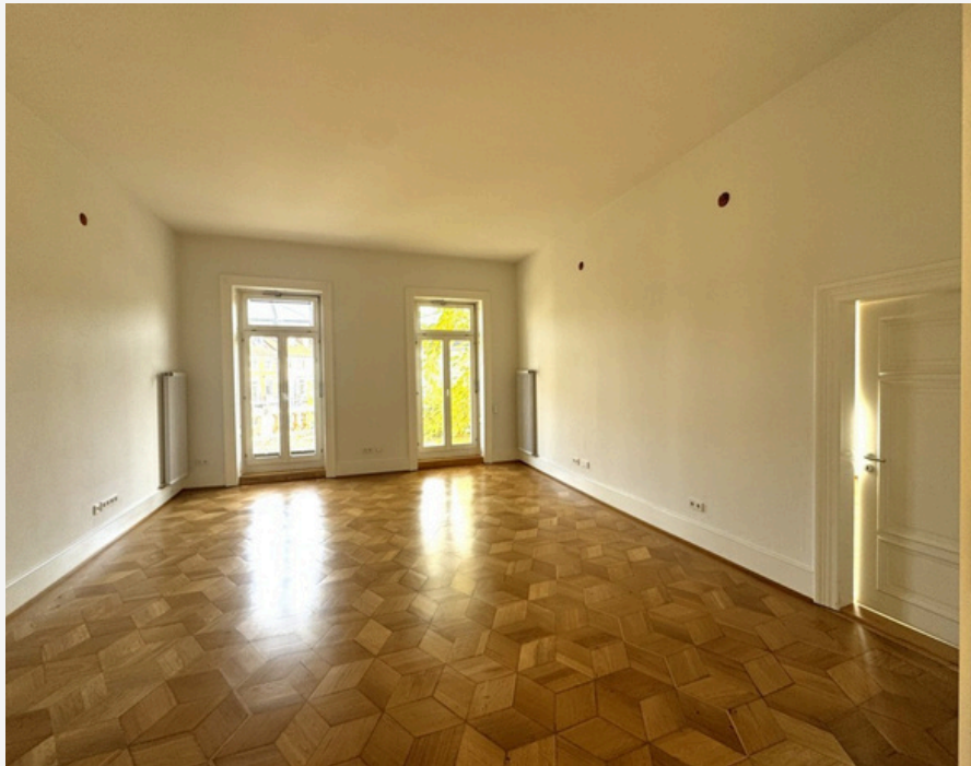
RAUM 8 (GRUNDRISS)