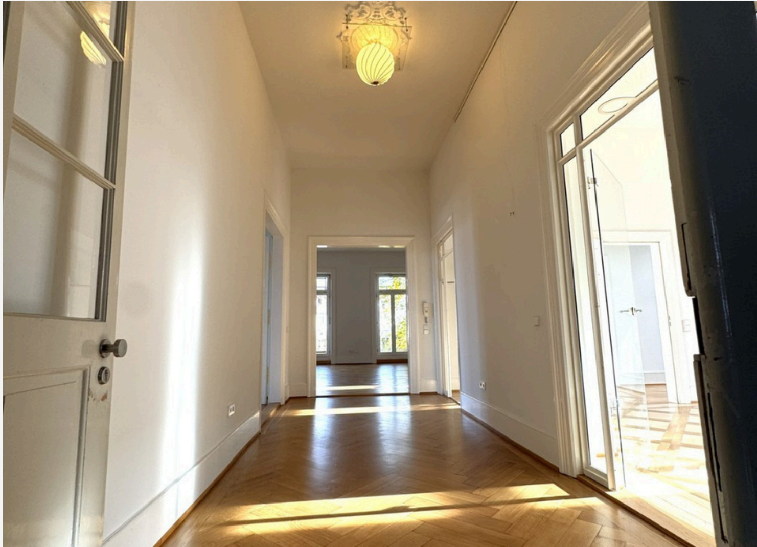
FLUR / EINGANGSBEREICH 1. OBERGESCHOSS