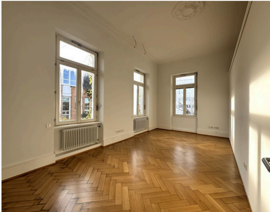
RAUM 1 (GRUNDRISS)