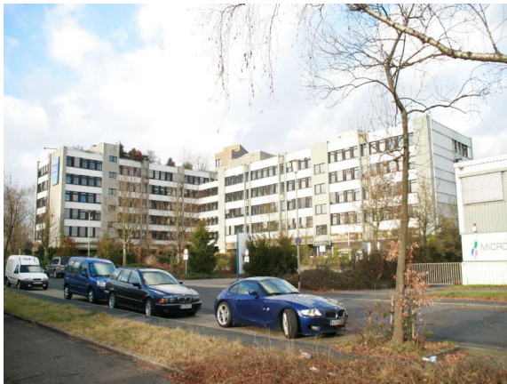
Sicht von der Heinrich Hertzstr aus