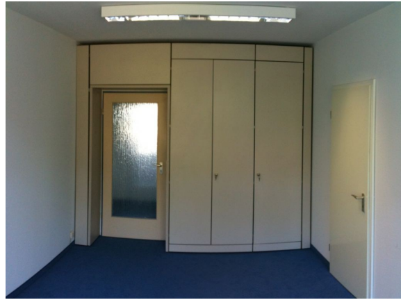
15m 2 mit Wandschränken