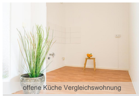
offene Küche Vergleichswohnung