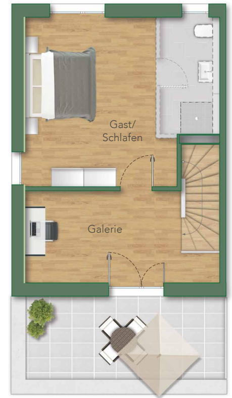
— DG —

Wohnfläche: Konstruktionsbedingte Änderungen vorbehalten