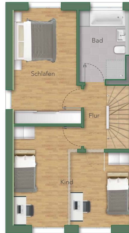
— OG —