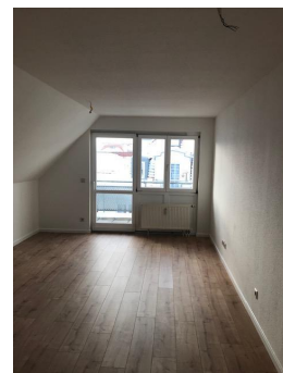
Wohnraum mit Balkon